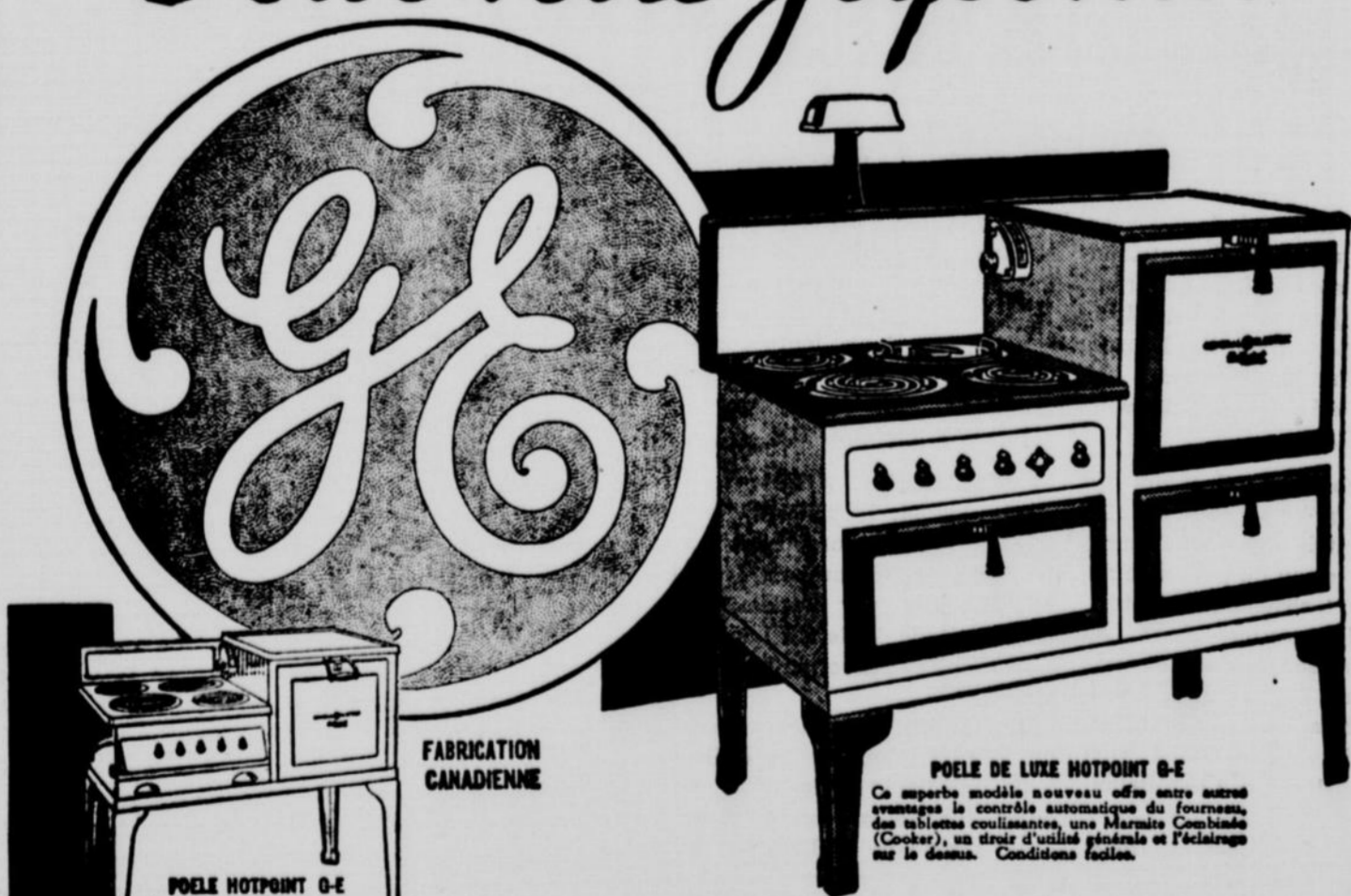
POELE HOTPOINT 0-E Avec des rayons plus serrés... préparé et fraîches... d'éléments Calrod H... plus rapides au... Plus, plus modique et... facile.