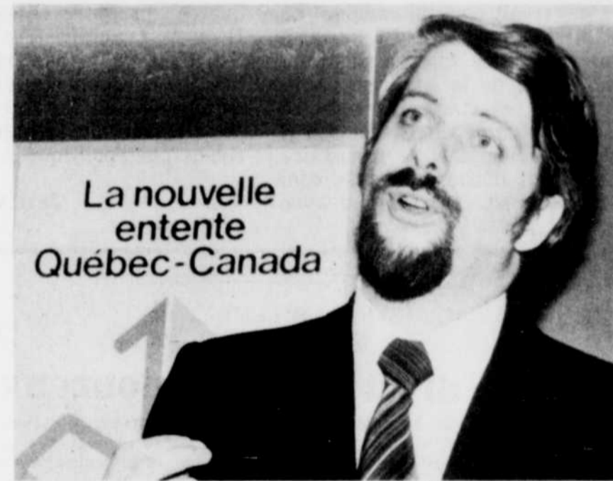
Le ministre Pierre-Marc Johnson a défendu les mérites de l'étapisme.

Les agriculteurs présents ont également cherché à savoir quand la région de l'Estrie sera incluse dans le zonage agricole. Parce que l'Estrie compte de nombreuses érablières, ils ont exprimé le souhait que cette production soit protégée dans les plus brefs délais.