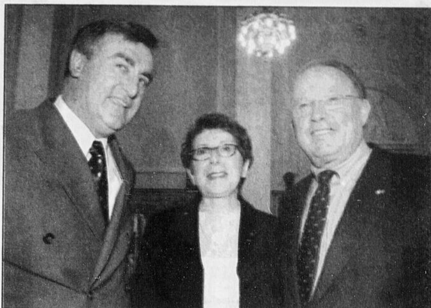
Le premier ministre du Québec, Bernard Landry, a procédé hier au lancement des travaux de construction de la Grande bibliothèque du Québec, à Montréal, en compagnie de plusieurs personnalités, dont l'ancien premier ministre Lucien Bouchard, initiateur du projet, et de la présidente-directrice générale de la Grande bibliothèque, Lise Bissonnette.

Elle occupera le quadrilatère formé des rues Berri, Ontario, Maisonneuve et Savoie, face au terminus d'autobus, étant reliée à la station de métro Berri-UQAM.