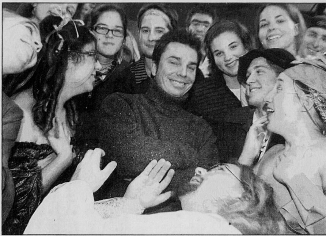
Pendant toute la journée, hier, le comédien Christian Bégin a rencontré de jeunes amateurs de théâtre de la région, dans la foulée des activités entourant les Mordus du théâtre. On le voit ici avec des élèves du Séminaire de Sherbrooke.

Il faut dire que c'est avec une désarmante simplicité et une ouverture de coeur peu banale que le comédien s'est adressé à son auditoire, proposant comme première et seule mise en situation qu'il est un comédien, un auteur, un metteur en scène, un professeur, un humoriste et un père de famille. Sans oublier, en complément, qu'il était un homme fatigué, n'ayant pas pris de va-