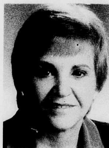
Mme Madeleine Bélanger, députée de Mégantic-Compton