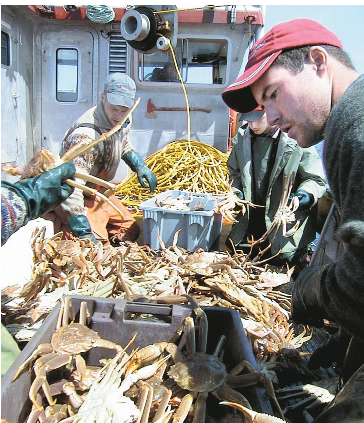
FABIEN DEGLISE LE DEVOIR

Le Canada est le premier producteur de crabes des neiges au monde et au moins 75% de ses exportations vont aux États-Unis.