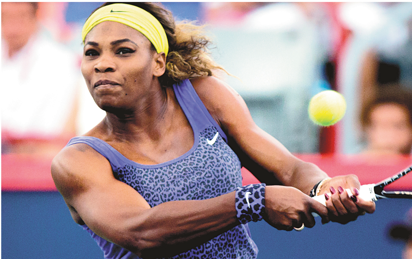
Pour son entrée en scène sur le court montréalais, Serena Williams a prouvé qu'elle n'était pas prête à être délogée de son premier rang mondial.