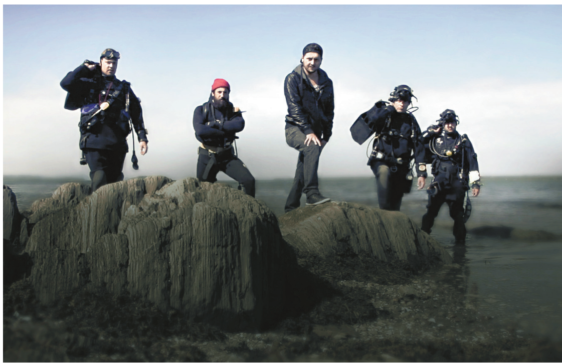
Deux nouveautés: Chasseurs d'épaves , une émission présentée à Historia, et La reine , un drame historique diffusé à Série+.