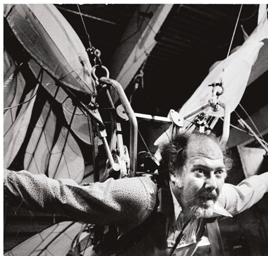
FILMS WE LIKE Robert Altman essayant le dispositif volant mis au point par le protagoniste de Brewster McClood.

Il y a quelque chose d'émouvant à entendre Robert Altman conter son parcours singulier. Entre ses premiers pas en tant que réalisateur de films industriels à Kansas City, ses débuts difficiles à Hollywood (égayés néanmoins par Alfred Hitchcock qui l'embaucha sur son émission hebdomadaire), son épanouissement en marge des grands studios, son retour en grâce auprès de ceux-ci le temps d'une décen-