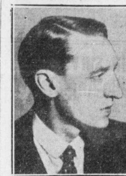
LIONEL DAUNAI, qui l'on verra dans "Princesse Czardas", au Monument national, les 24, 25, 26 et 27 octobre prochains en soirée.