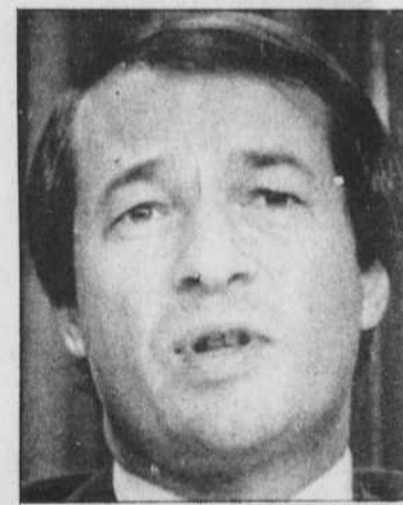
Le ministre Otto Jelinek

« Je vous garantis qu'au cours des trois ou quatre prochaines années, nous allons accroître la participation financière des corporations. Elles sont là et doivent être approchées correctement. Il faut leur donner quelque chose en retour. »