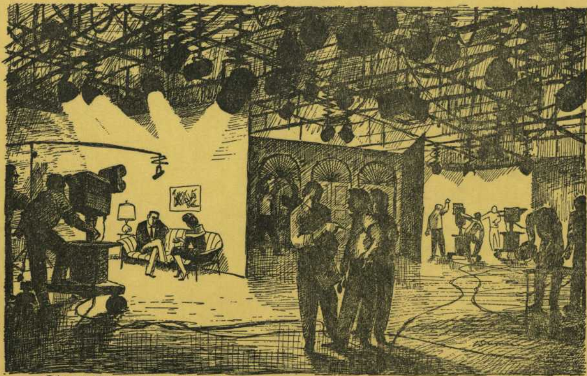
Rehearsal in Studio "D", CFCM-TV and CKMI-TV, Québec.