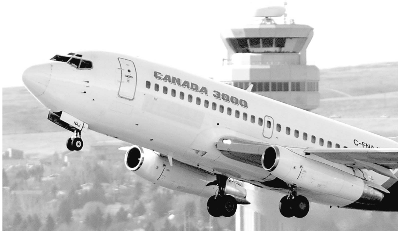
Un avion de Canada 3000 passe devant une tour de contrôle de l'aéroport de Calgary.

Cependant, dans les destinations-soleil, les hôteliers se réveillent. Ils s'aperçoivent qu'à quatre semaines du début de la haute saison, ils sont loin d'avoir fait le plein de réservations pour les périodes de pointe comme les Fêtes ou les congés scolaires. Alors, ils commencent à revoir leurs prix à la baisse. « Au cours des prochains jours, nous annoncerons une série de nouvelles réductions, pendant une période limitée », annonce Luce Prud'homme, directrice du marketing de Tours Mont-Royal. À