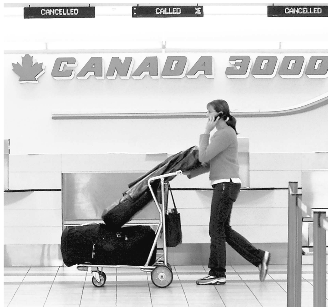
Une voyageuse pousse ses bagages devant les comptoirs fermés de Canada 3000 à l'aéroport international de Halifax.

Mais un jugement rendu par la Cour d'appel du Québec, en 1998 (Multitour contre Minerve) dans une cause similaire qui impliquait la compagnie Minerve en faillite, a statué que l'agent de voyages vendait, non pas un titre de voyage, mais un service. Et qu'il était responsable si le service n'était pas rendu.