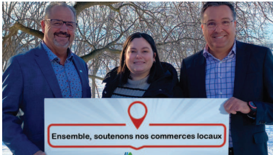
La MRC de Marguerite-D'Youville a lancé un nouveau projet « Ensemble, soutenons nos commerces locaux ».