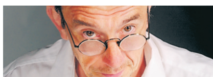
PIERRE FOGLIA AUX CHAMPIONNATS MONDIAUX D'ATHLÉTISME