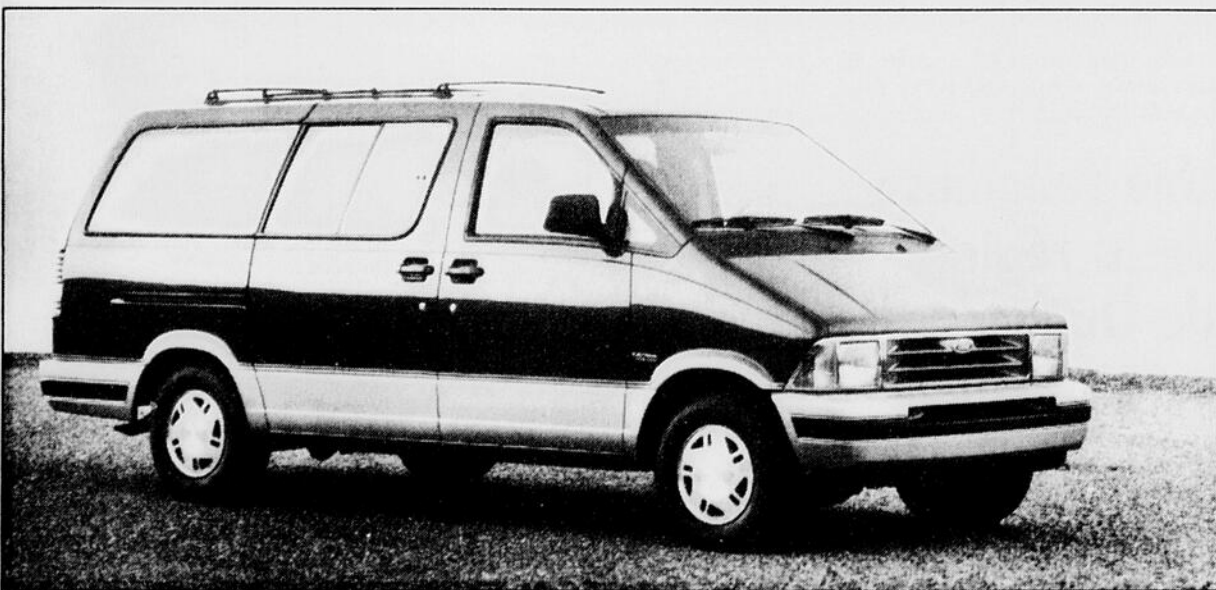
La Ford Aerostar à quatre roues motrices propose un choix de longueur d'empattement: régulier ou long (ci-dessus).

L'efficacité d'une mini-fourgonnette à deux roues motrices est généralement bonne en conduite de tous les jours, même l'hiver, mais il va de soi que deux roues motrices supplémentaires peuvent être très utiles quand les conditions se font difficiles.