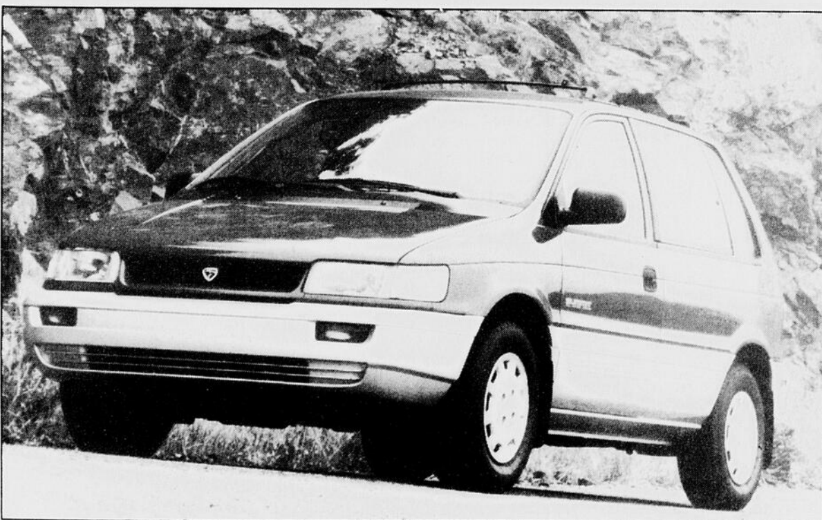
Se distinguant par des dimensions réduites en comparaison avec celles des autres mini-fourgonnettes, la Colt / Summit 4 × 4 reçoit pour 1993 un quatre cylindres optionnel plus puissant.

personnes désirant un espace de chargement plus imposant.