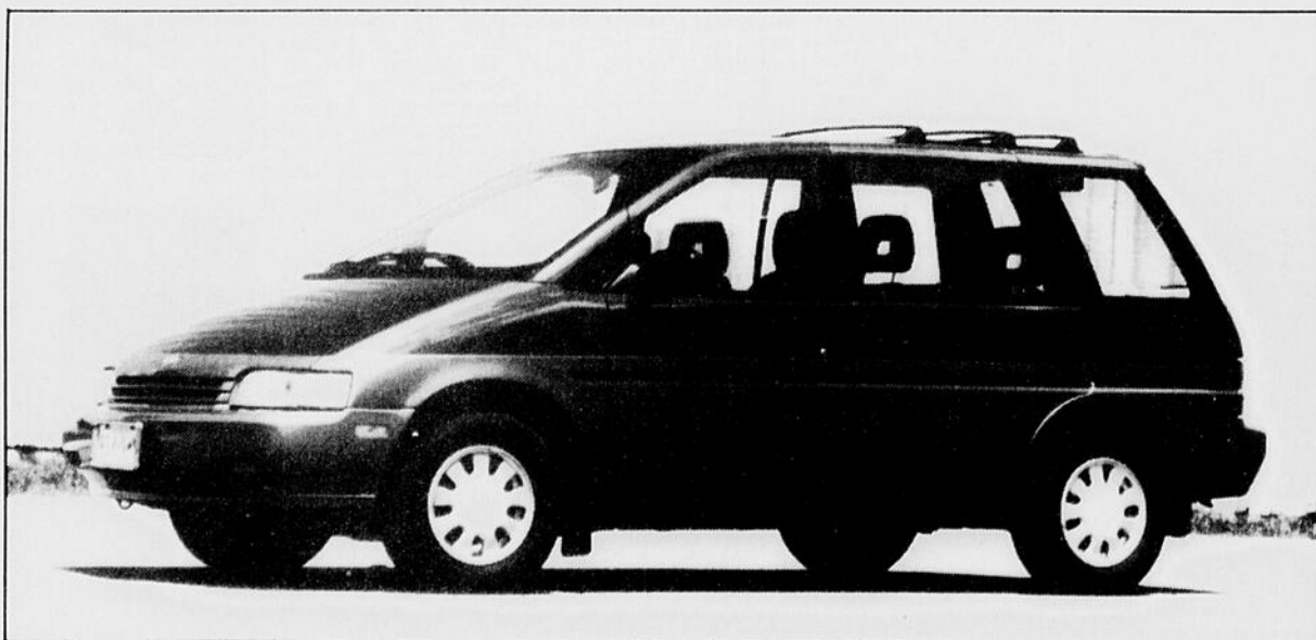
La Nissan Axxess est offerte en exclusivité au Canada sur le marché nord-américain.