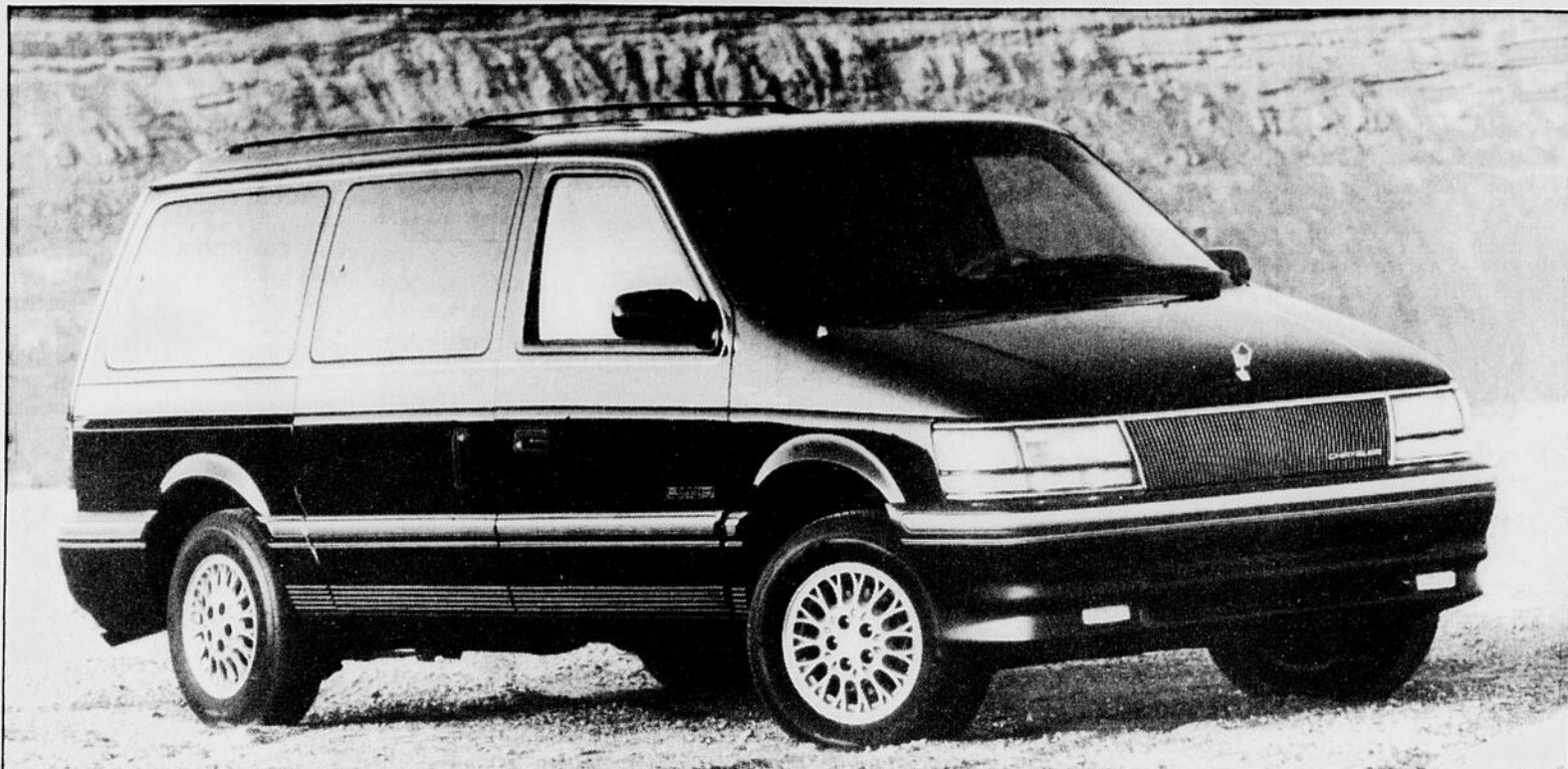
Les mini-fourgonnettes Chrysler sont toutes disponibles en version à quatre roues motrices.

La plus populaire des mini-fourgonnettes offre deux configurations de carrosserie dans sa version à traction intégrale, soit la caisse régulière et la version à empattement long pour les