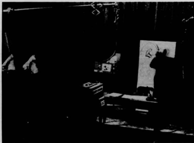
DESIGN FOR LIVING : le réputé peintre canadien Arthur Lismer explique, par dessins progressifs, l'évolution à travers les âges des objets qui nous entourent. Cette fort populaire série de programmes revient toutes les semaines à l'horaire de CBFT, et passe le mercredi soir, de 8 h. 15 à 8 h. 30. Une leçon de choses intéressante, éducative et à l'occasion humoristique.

Les "classes" de Lismer devinrent fameuses dans le monde entier, et il fut invité à répandre ses théories aux Etats-Unis, en Nouvelle-Zélande, en Australie, en Afrique du Sud, et dans plusieurs pays de l'Europe.