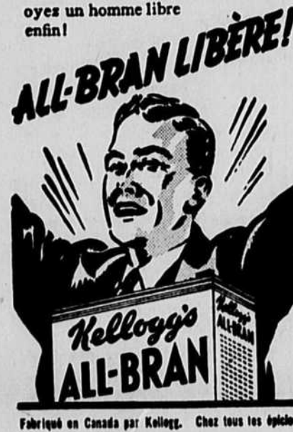
Fabriqué en Canada par Kellogg. Chez tous les épiciers.

LA CONSTIPATION TYRANNISE ● La constipation est un véritable fléau. Elle vous torture, vous tyrannise sans répit. Appelez ALL-BRAN à l'aide, c'est votre plus vaillant allié. Parce qu'il contient le tonique intestinal naturel, la vitamine B 1 , et qu'il fournit le "volume" nécessaire à des habitudes "régulières," ALL-BRAN vous aidera à vous libérer de votre constipation causée par le manque de "volume" dans l'alimentation. Mangez ALL-BRAN chaque jour, comme céréale ou sous forme d'appétissants et délicieux muffins, buvez beaucoup d'eau... oyez un homme libre enfin!