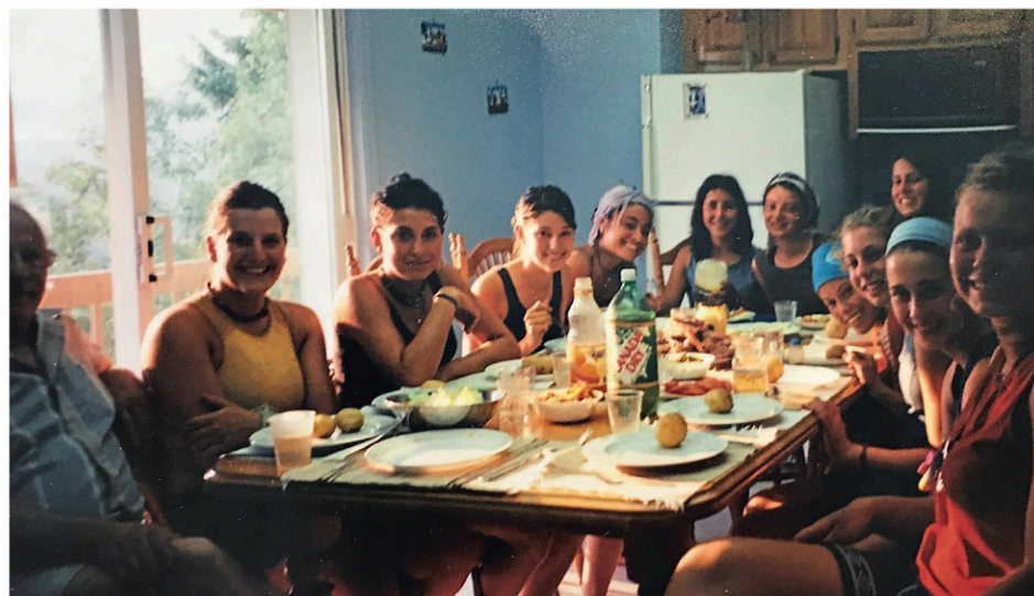
Le groupe, en 2002, au moment de sa halte chez M. Gagnon.

M. Gagnon souhaitait avoir de leurs nouvelles, simplement pour voir comment elles vont. «Elles étaient d'un peu partout au Québec», se souvient-il.