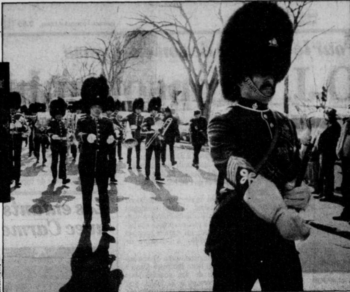
La fanfare militaire de Québec fait vivre 35 diplômés du Conservatoire, tient 250 engagements par année et contribue à la renommée du Royal 22e à travers le monde entier.

La fanfare joue du Gilles Vieneault, du Félix Leclerc, du