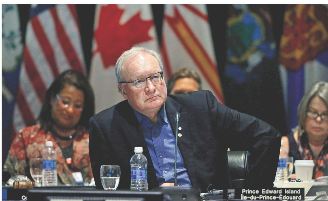
Le premier ministre de l'Île-du-Prince-Édouard, Wade MacLauchlan

Les résultats à l'Île-du-Prince-Édouard sont intéressants à décortiquer, car ils permettent de penser la réforme électorale en dehors d'une logique binaire : pour ou contre une réforme particulière. En effet, les référendums provinciaux passés n'avaient que soumis une réforme spécifique aux électeurs, qu'ils devaient soit soutenir, soit rejeter. Ainsi, les électeurs de la Colombie-Britannique ont rejeté en 2005 puis en 2009 le « vote unique transférable ». Ceux de l'Île-du-Prince-Édouard ont rejeté la