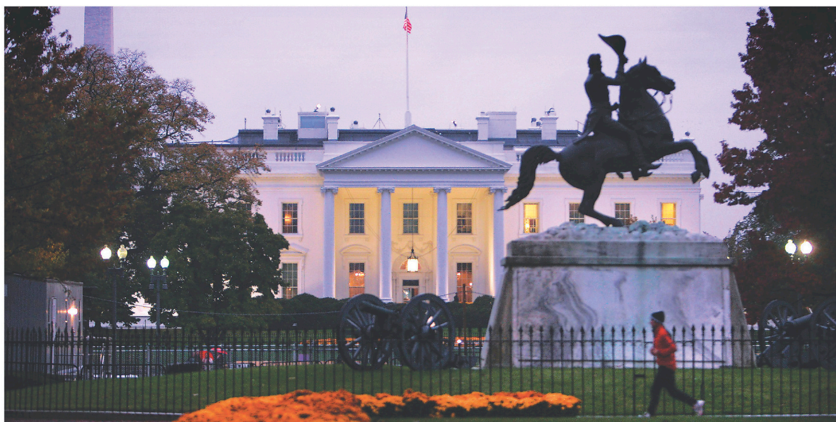
Le futur président des États-Unis n'a pas d'équivalent, bien qu'il fasse songer par certains aspects à Andrew Jackson (1767-1845, on peut voir une statue de lui devant la Maison-Blanche), un président atypique.

Le règne de l'homme blanc en colère ne fait que commencer.