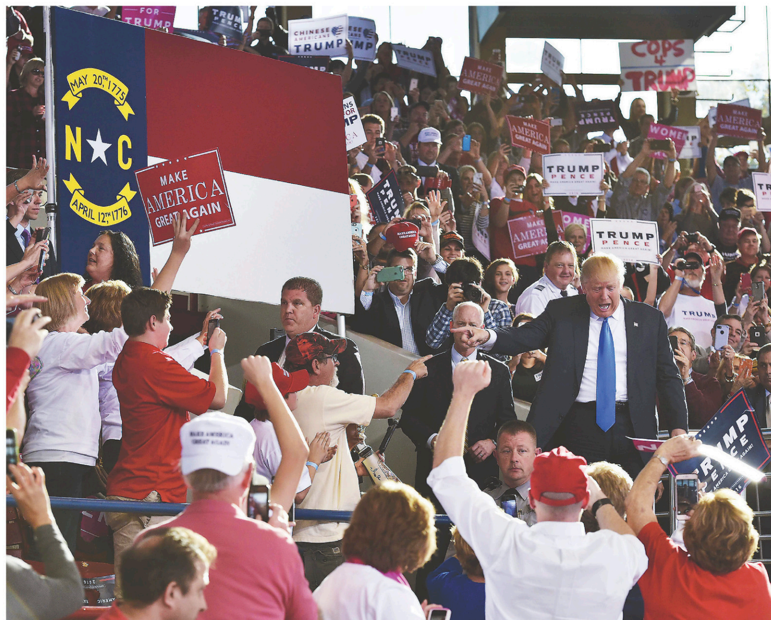
Donald Trump entouré de ses partisans à Raleigh, en Caroline du Nord, la journée avant son élection

On comprend alors mieux l'enjeu fondamental de cette nouvelle réforme de l'aide sociale. En rendant conditionnelle une bonne partie de l'aide de dernier recours, le gouvernement libéral vise à instaurer la peur de la faim chez les nouveaux demandeurs d'assistance et leurs familles. Dans une société démocratique, qui devrait normalement privilégier le principe de la citoyenneté à celui du marché, il faudrait plutôt défendre cette aide comme un droit social inaliénable, et même la bonifier afin de libérer enfin nos concitoyens les plus défavorisés de cette peur d'un autre âge.