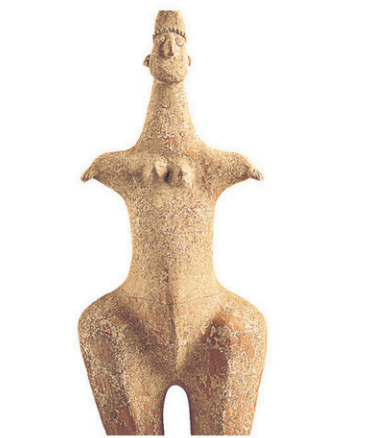
Une statuette stéatopyge avec de grosses hanches, un petit ventre et de petits seins