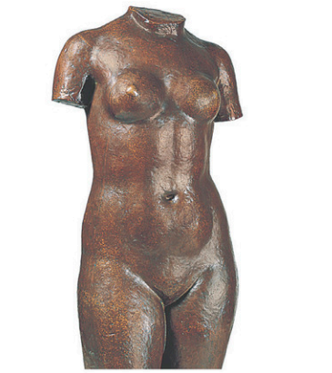
Un torse de jeune femme, par Aristide Maillou, 1935

Le phénomène des canons de beauté n'est pourtant pas nouveau. Dans la salle du musée consacrée à l'art antique, on peut voir une statue d'un Apollon Chigi, d'après un original grec datant de 370 ans avant Jésus-Christ. Selon les standards de Polyclète, explique Mélanie Deveault, un corps canon devait alors compter sept fois la hauteur de sa tête. Plus tard, un autre sculpteur grec, Lysippe, a pour sa part établi que le corps idéal devait compter huit fois la hauteur de sa tête. Autres temps, autres idéaux.