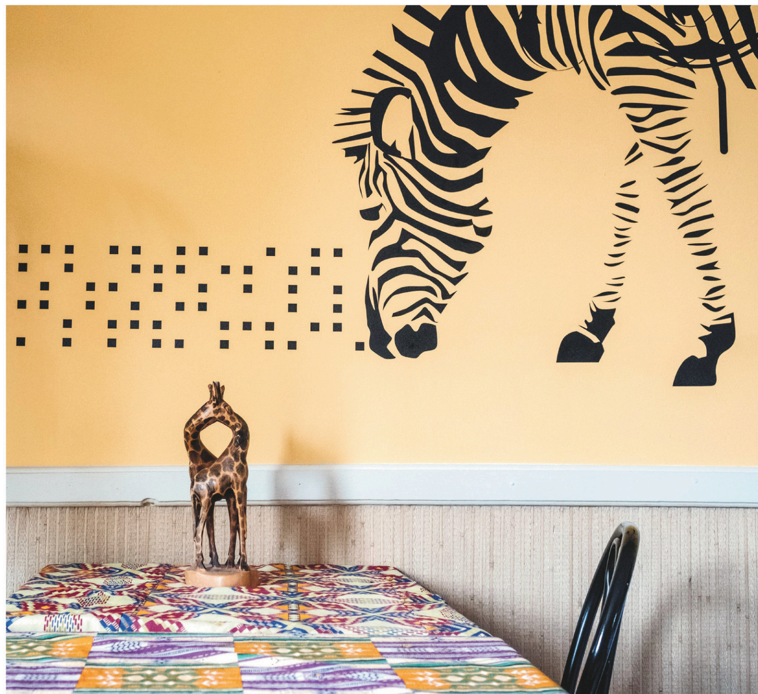
Le petit local de La Calebasse est décoré simplement. Un zèbre géant est peint au mur tandis qu'un écran diffuse en sourdine des vidéoclips d'artistes africains et caribéens.

Les plus: la possibilité de découvrir, pour un prix très abordable, des ingrédients et des mets qui nous font sortir un peu de notre ordinaire occidental. Mais assurez-vous d'avoir du temps. Beaucoup de temps.