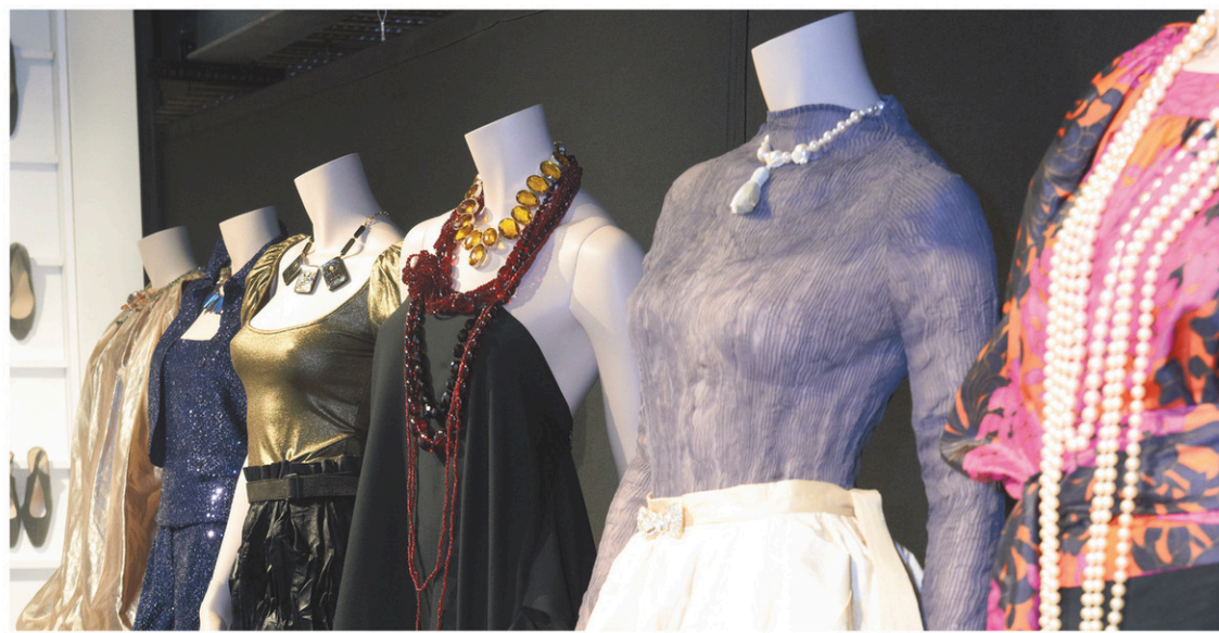
Un décor de l'exposition Parcours d'une élégante au Musée de la mode.