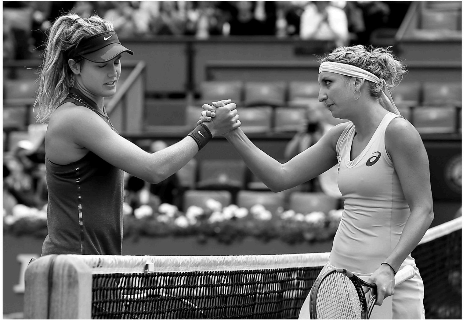
Eugenie Bouchard (à gauche) félicite Tímea Babos après la victoire de cette dernière.