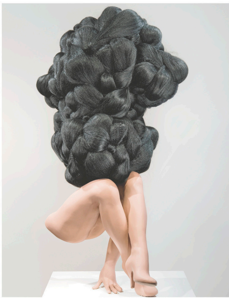
La sculpture She was a big success de l'artiste montréalaise Valérie Blass montre le corps tronqué d'un mannequin, enseveli sous une montagne de cheveux noirs.

Deux étages plus bas, et quelques siècles plus tard, et une sculpture de l'artiste montréalaise Valérie Blass, She was a big success , montre le corps tronqué d'un mannequin, enseveli sous une montagne de