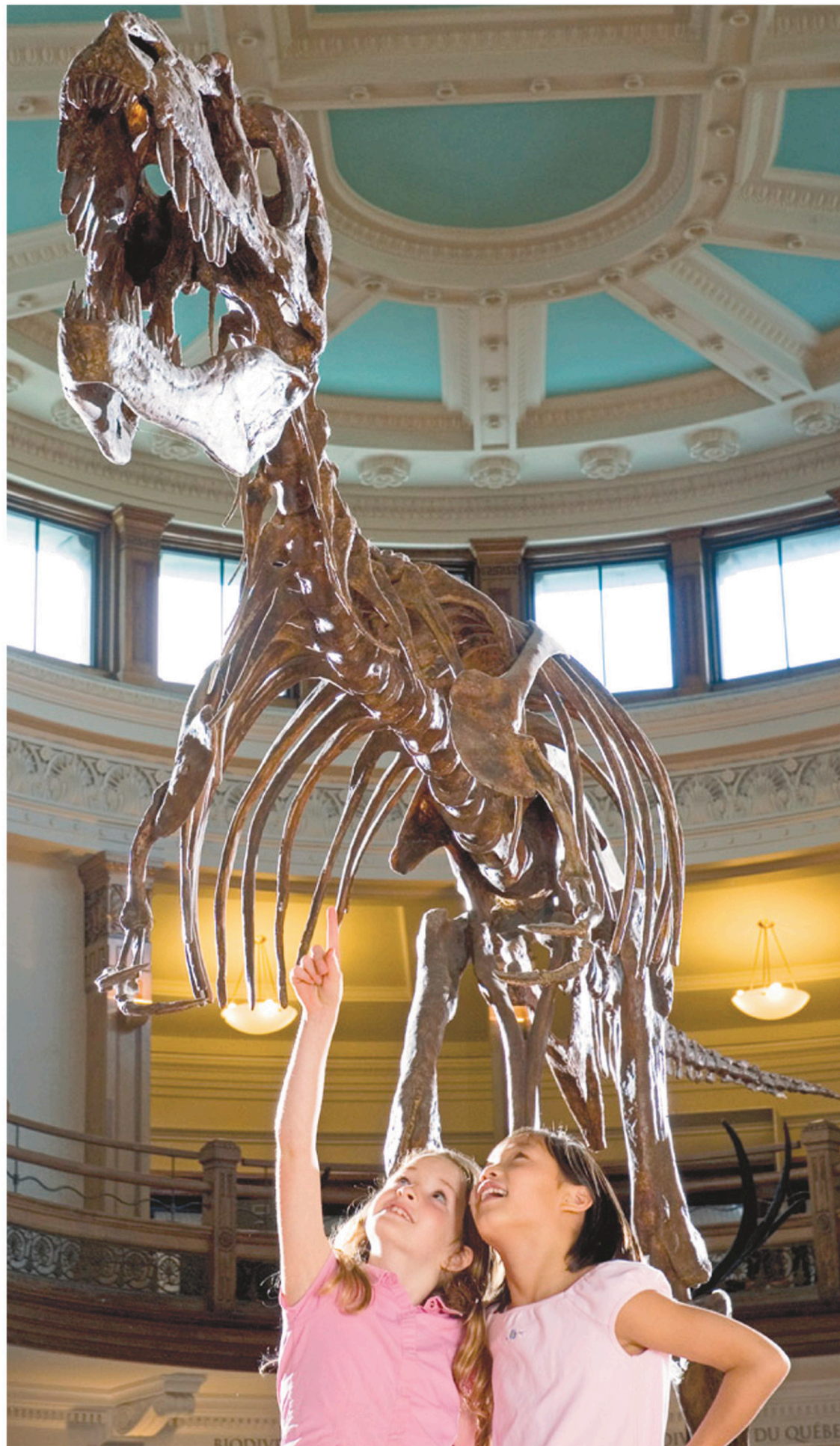
Fascination enfantine au Musée Redpath.

Un musée perché à flanc de montagne, un autre au pied des rapides de Lachine et un autre encore, situé en plein cœur du fleuve Saint-