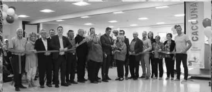
INAUGURATION DU Centre de Loisirs Place St-Georges Pages 16-17

CAMPAGNE MEMBERSHIP AUTOMNALE - 22 SEPTEMBRE AU 31 DÉCEMBRE DÉPOSEZ VOTRE 5.$ DANS LA BOÎTE PRÉVUE AU MARCHÉ DESBIENS & FILS