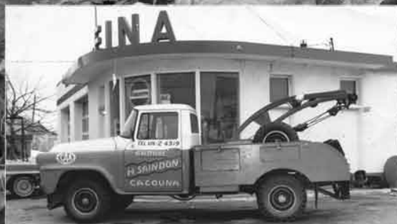
Les 60 ans du Garage Saindon Pages 19-20