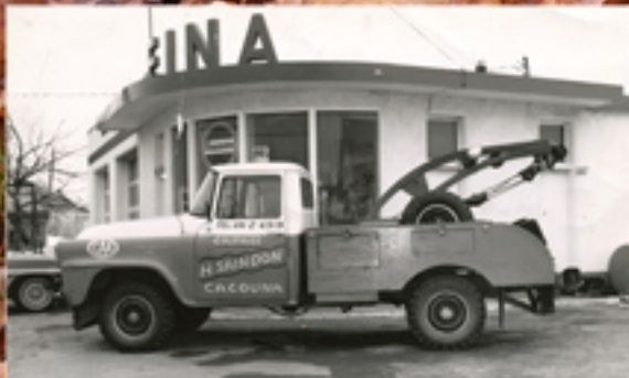
Les 60 ans du Garage Saindon Pages 19-20