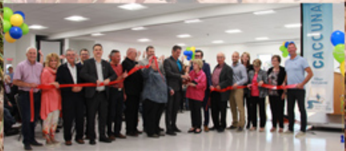
INAUGURATION DU Centre de Loisirs Place St-Georges Pages 16-17

CAMPAGNE MEMBERSHIP AUTOMNALE - 22 SEPTEMBRE AU 31 DÉCEMBRE DÉPOSEZ VOTRE 5.$ DANS LA BOÎTE PRÉVUE AU MARCHÉ DESBIENS & FILS