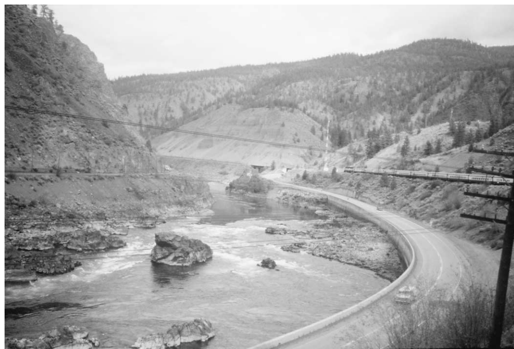
Symbole d'unité nationale, « nos » Rocheuses sont-elles en péril ?

Dans l'Himalaya, également, les incassantes expéditions ont fait de l'Everest « la plus haute décharge du monde ». En