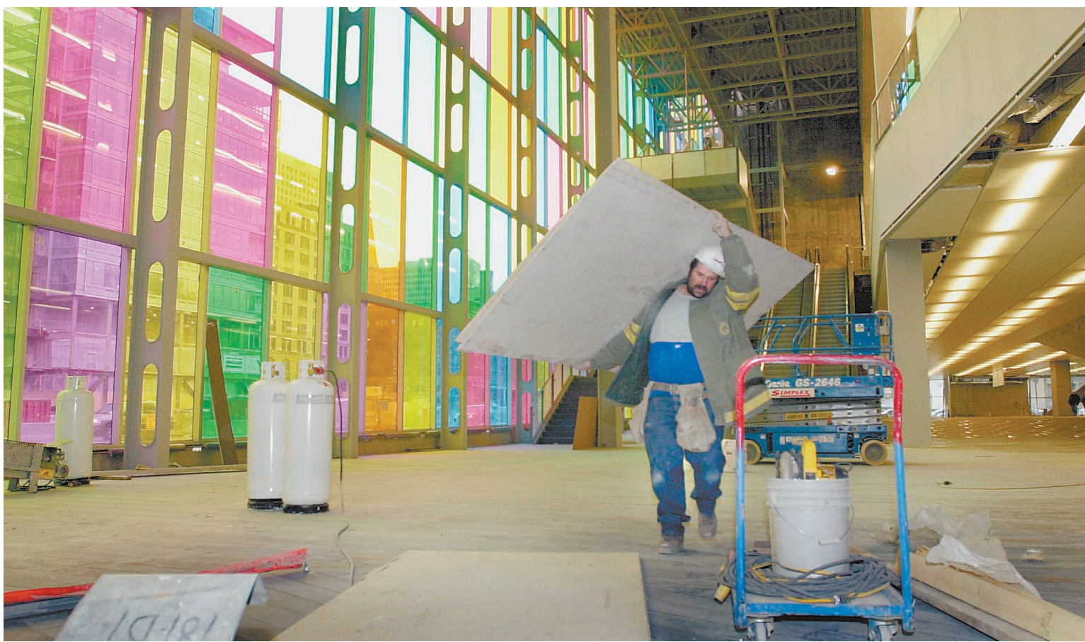
Les ouvriers étaient affairés, hier, sur le chantier du Palais des congrès, où se tient dès aujourd'hui la rencontre annuelle de l'industrie du papier.

Veillera-t-il sur tous les sans-logis coincés par la crise du logement le 1 er juillet prochain ? Pas sûr.