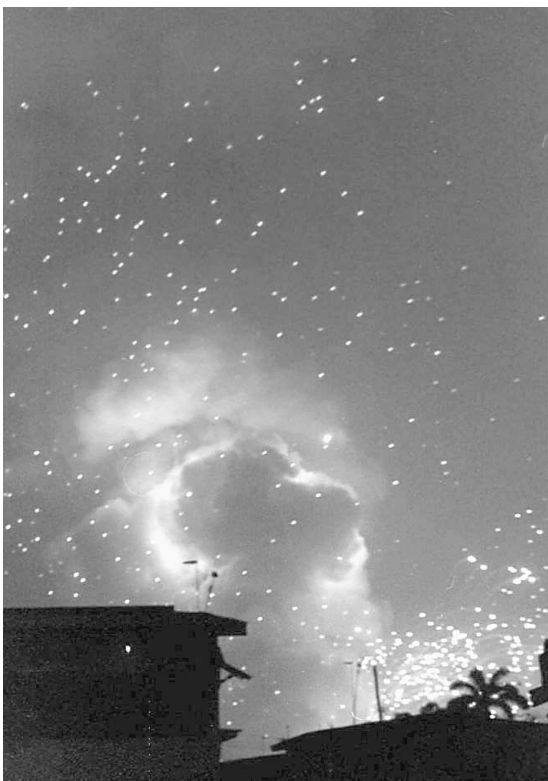
Des dizaines d'explosions ont embrasé le ciel de Lagos, capitale du Nigeria et plus grande ville d'Afrique noire, provoquant la fuite de centaines de milliers d'habitants.

Cet appel télévisé n'a pas empêché les habitants de Lagos, qui craignent les pillages, de se barricader chez eux, tandis que les services hospitaliers convergeaient vers les lieux du désastre.