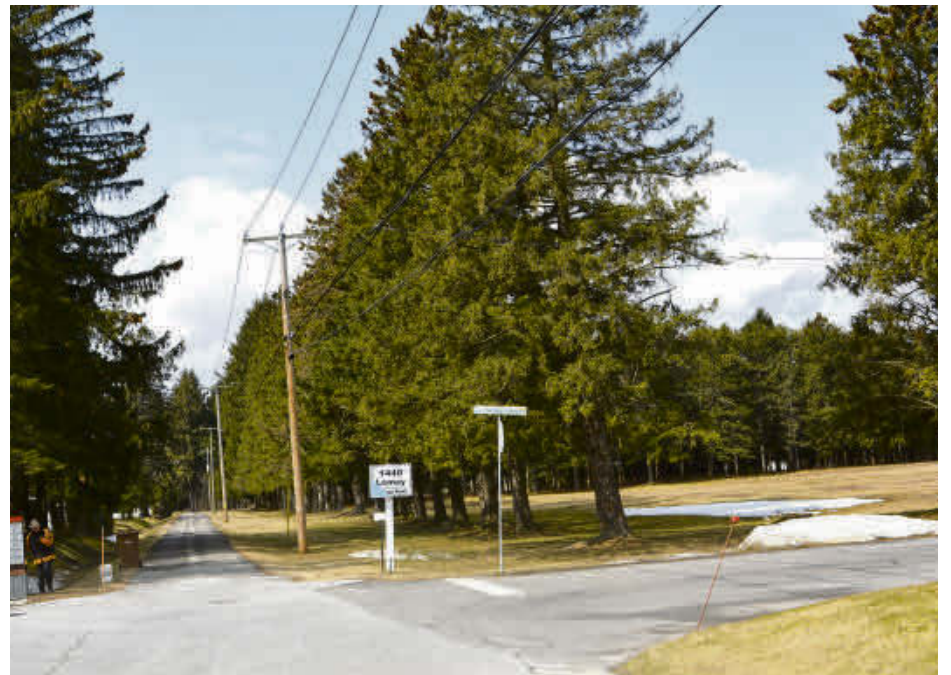
Des opposants au projet de complexe pour retraités actifs Tandem, qui sera érigé au coin des rues Lemay et Hormidas-Lemoyne à Acton Vale, craignent qu'une partie de la rue Lemay soit éventuellement à sens unique.

« Si on veut favoriser la croissance de la ville, il faut examiner de près des projets qui augmenteront les revenus au niveau de la taxation. Les promoteurs ont démontré qu'ils étaient à l'écoute en annonçant qu'il n'y aura pas de cuisine