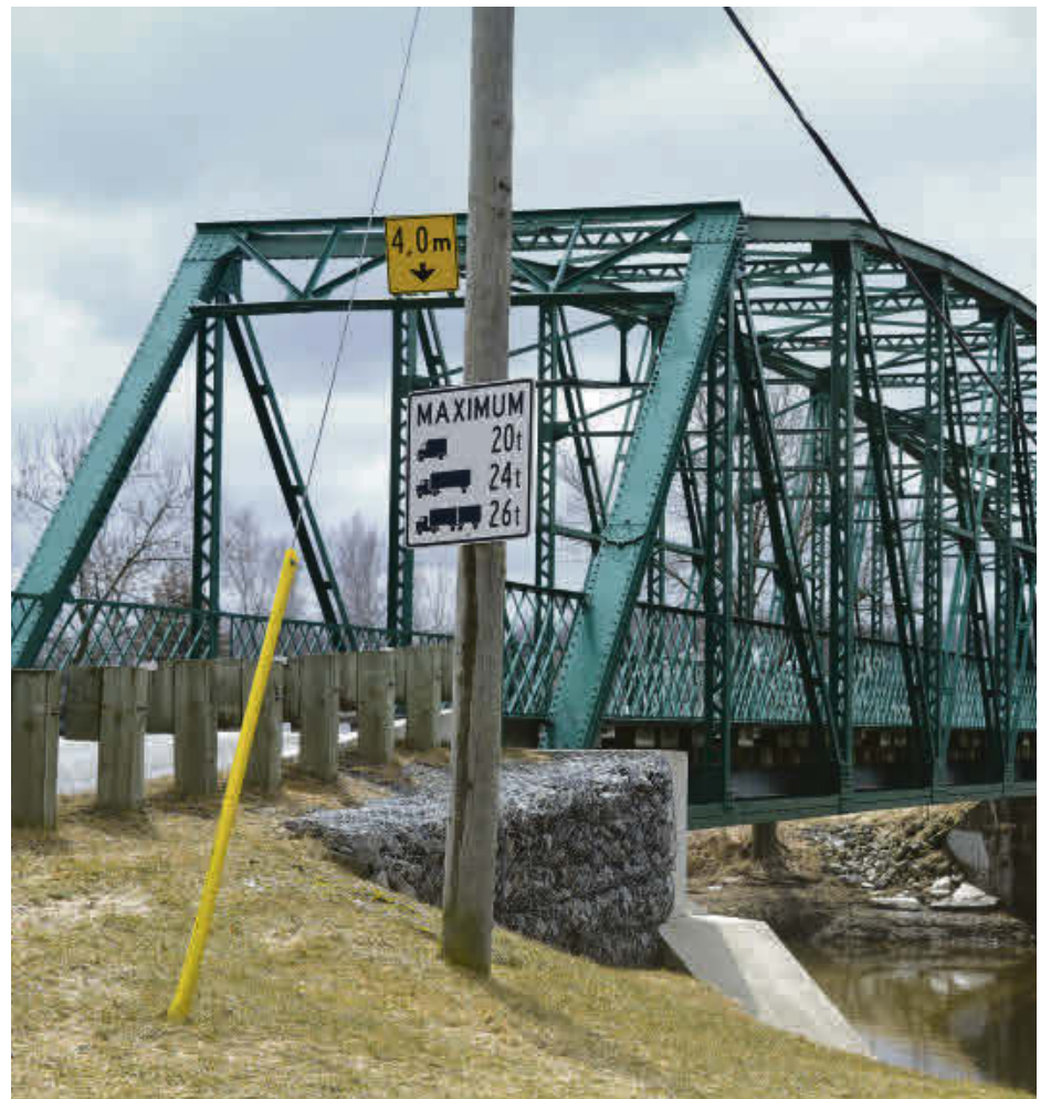
Le pont Provost, fermé à la circulation depuis janvier, devrait être réouvert à la circulation d'ici la fin de l'année 2018.

« Pour moi, c'est un détour d'environ 10 km par jour. Et c'est la troisième fois depuis 2010 que le pont doit être fermé temporairement. Ce n'est pas très agréable », allègue une d'entre elles.