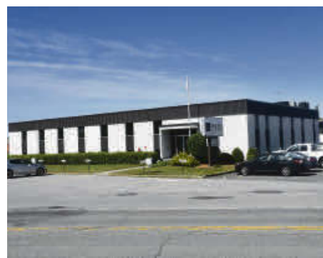
Un accident de travail a coûté la vie, vendredi soir, à un employé de Beaulieu Canada

« Cet incident tragique nous rappelle que la santé et la sécurité représentent un enjeu majeur, autant pour les employés que pour l'entreprise. Cela nous rappelle également que c'est la responsabilité de chacun de nous, en tant qu'équipe, de faire de la santé et sécurité une valeur indissociable de qualité de vie au travail », déclare l'entreprise.