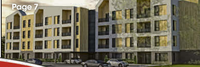
(maquette de Faucher Gauthier Architectes)