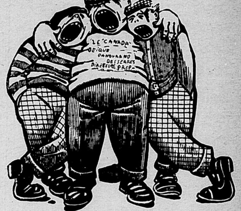
Instantané de trois reporters du "Canada" en apprenant que peut-être, à cause de la guerre, ils auront une troisième diminution de salaire.

Si les étudiants anglais faisaient une démonstration des plus dévergondées, les journaux appelleraient "CAPITO"