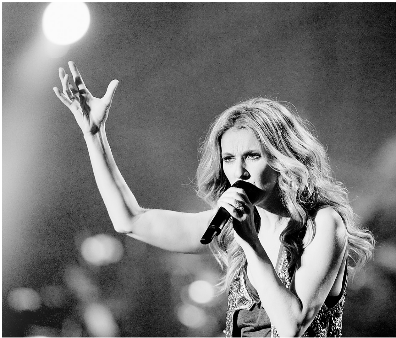
Céline Dion, lors de son récent spectacle dans le cadre du 400 e anniversaire de Québec.

La carrière de Céline Dion a évolué en parallèle avec l'histoire du gala de l'ADISQ. Elle a reçu ses quatre premiers trophées de l'ADISQ, dont celui de révélation de l'année, au gala de 1983. En 1990, elle a refusé le Félix de l'artiste anglophone de l'année, après avoir lancé son premier album anglais, Unison . Puis en 1998, elle a animé le 20 e gala de l'ADISQ en compagnie de Jean-Pierre Ferland, André-Philippe Gagnon et René Simard. Elle y est revenue en 2001, comme invi-