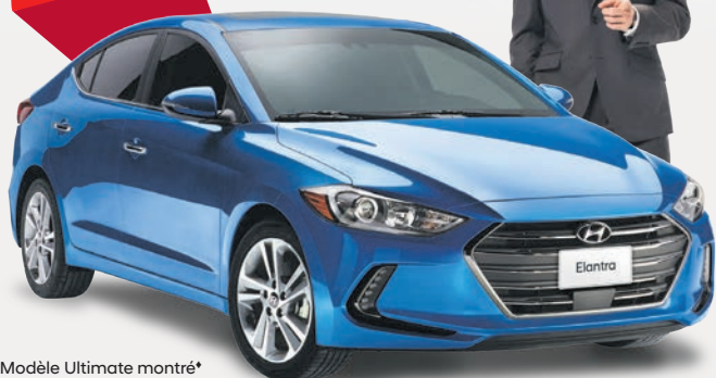
Modèle Ultimate montré*