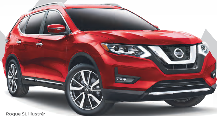
Rogue SL illustré*