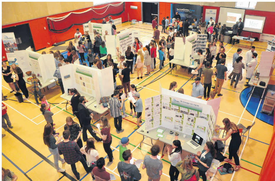
Treize groupes d'étudiants ont tenu des kiosques au 12 e colloque scientifique du CIRADD.

Au total, 13 kiosques d'étudiants traitaient, entre autres, d'acceptabilité sociale, d'achat local, de la culture Quechua, de fromage aux algues et d'énergie solaire. Les deux autres centres collégiaux de transfert de technologie (CCTT) que sont le TechnoCentre éolien et Merinov tenaient aussi des kiosques cette année. « Nous sommes ici pour appuyer l'initiative. C'est vraiment un événement dont on peut être