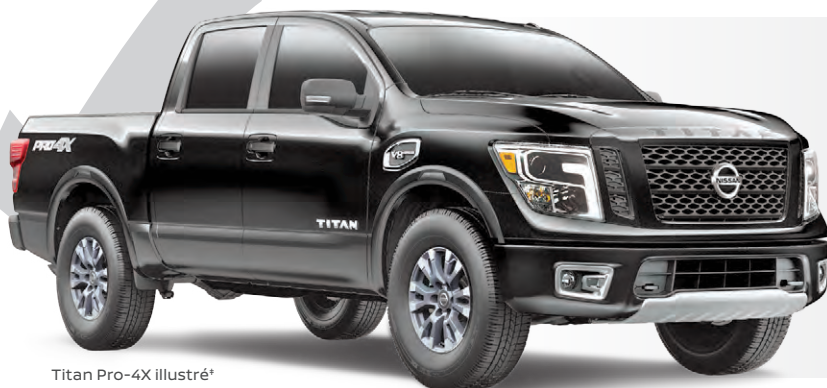
Titan Pro-4X illustré*