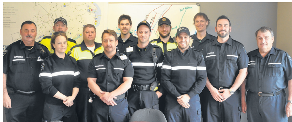
Les paramédics du Service ambulancier de la Baie sont inquiets de l'état actuel de la couverture.

Comme les ambulanciers ne peuvent traiter directement avec le Centre intégré de santé et de services sociaux (CISSS), ils interpellent les élus municipaux de