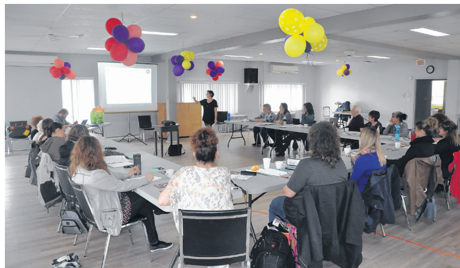
À Caplan, une vingtaine de personnes ont assisté aux ateliers.

Parmi les participants, on retrouvait principalement des représentants d'organismes communautaires, mais aussi le maire de Saint-Godefroi, et de simples citoyens, dont une dame de 103 ans. Le Collectif gaspésien regroupe des organismes communautaires, syndicats, et membres individuels, de même qu'un représentant du CISSS.