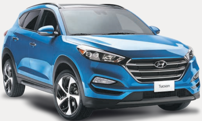
Modèle Ultimate montré*

+ Le prix du fabricant sur les Accent SE 2017