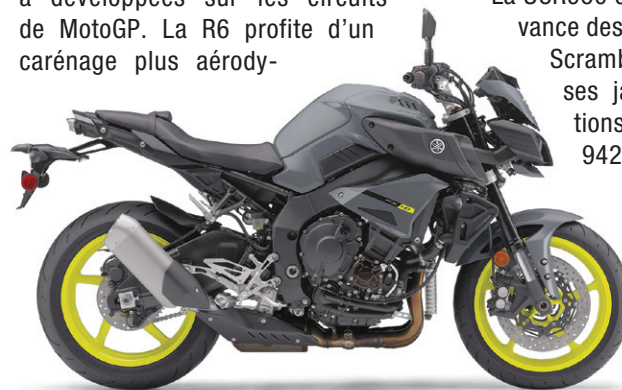
La Yamaha FZ-10

La SCR950 s'inscrit dans la nouvelle mouvance des motos au style d'antan, genre Scrambler des années 1960, avec ses jantes à rayons et les vibrations de son bicylindre en « V » de 942 cm 3 , qui développe beaucoup de couple à bas régime. La transmission à entraînement par courroie compte 5 rapports.