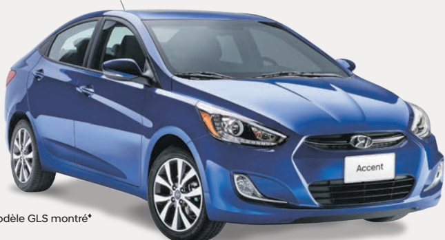
Modèle GLS montré*