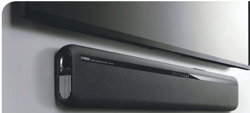
YAMAHA Barre de son 60 watts (675397) Bluetooth