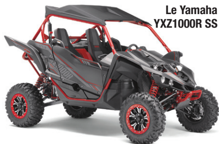
Le Yamaha YXZ1000R SS

Yamaha a introduit plusieurs nouveautés au cours des dernières années. En plus de dévoiler les nouveaux autoquads (véhicules côte à côte) YXZ1000R et Wolverine, le constructeur japonais a remodelé ses motoquads (VTT) Grizzly et Kodiak. Cette année, Yamaha met toute la gomme en introduisant la version SS du YXZ1000R — laquelle pousse encore plus loin les performances des autoquads ultra sportifs. Le YXZ1000R SS est équipé d'une toute nouvelle transmission séquentielle avec des palettes de changement de vitesses fixées sur la colonne de direction, en remplacement de la traditionnelle pédale d'embrayage et du levier de transmission.