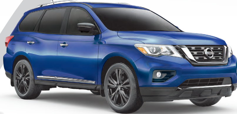
Pathfinder Platine Édition Minuit illustré*