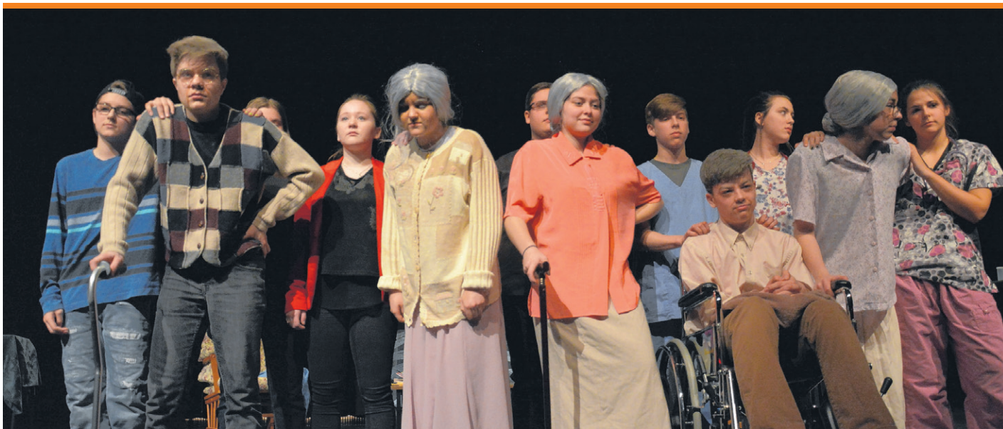
Près de 180 participants ont présenté 16 spectacles.