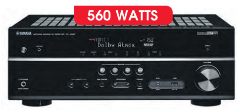
YAMAHA Récepteur de cinéma maison 7.2 canaux 3D (676087)

700 79 ÉCOFRAIS INCLUS 699,99 + 0,80 19 44 36 mois