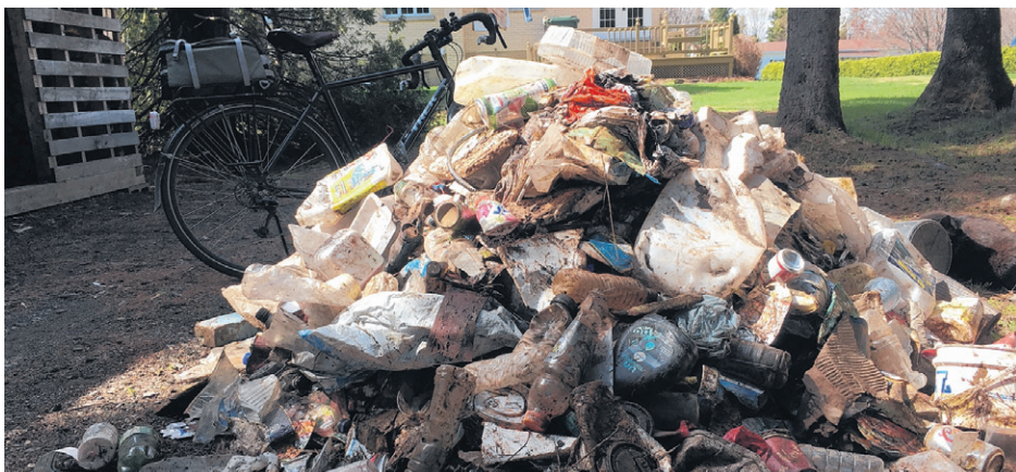
Les déchets ramassés sur une distance de 1 km aux abords de la route 132.

Alain Guay espère que sa sortie permettra de conscientiser les gens. Il prévoit également interpeller le député Sylvain Roy à ce sujet. (F.D.)