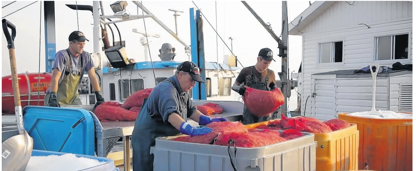
Les stocks du golfe ont diminué de 50% dans les 10 dernières années en raison notamment du réchauffement des eaux et du retour de poissons de fond comme le sébaste. (Photo Crevette du Nord Atlantique)

L'an dernier, les pêcheurs avaient obtenu un prix record alors que les crevettes étaient payées 1,50 $ pour la grosse et 1,00 $ pour la petite. La moyenne s'échangeait à 1,20 $. Cette année, les captures autorisées pour les crevettes du golfe du Saint-Laurent sont cependant en diminution de 11,5%. Il faut dire que les stocks du golfe ont diminué de 50% dans les 10 dernières années en raison notamment du réchauffement des eaux et du retour de poissons de fond comme le sébaste. La biomasse de crevettes nordiques a chuté de 30% seulement entre 2015 et 2016.