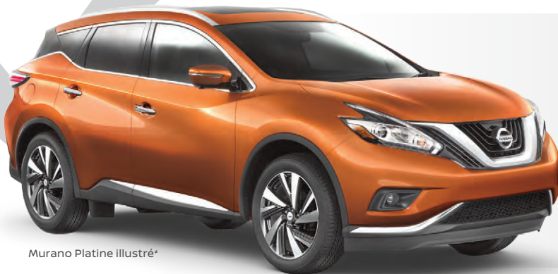
Murano Platine illustré*