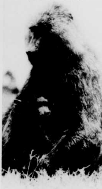
Le Comportement animal