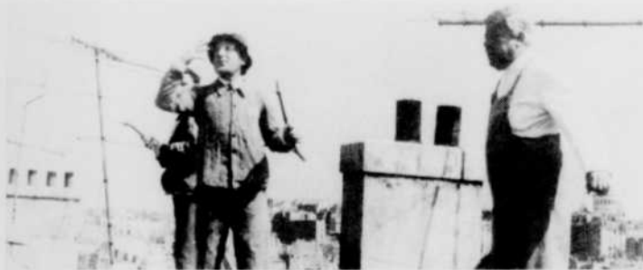
La Grande Lessive

Découragé et sérieusement agacé de voir ses élèves abrutis et ensommeillés par de longues soirées passées devant le petit écran, le professeur Saint-Just décide de déclencher une opération visant à saboter la réception des ondes hertziennes dans certains quartiers de Paris et à obliger ses étudiants à retourner à leurs bouquins. Agréablement surpris par le succès de cette initiative, Saint-Just et deux camarades décident d'étendre leur champ d'action. De vives protestations de l'auditoire de « l'OVTF » incitent la police à déclencher une enquête afin de découvrir l'auteur de ce crime monstrueux, ce qui donne lieu à une savoureuse poursuite sur les toits de Paris.