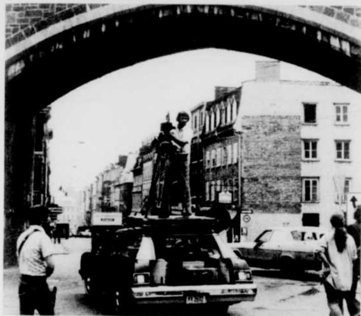
Quand on vous dit que la police québécoise a collaboré...

Rue Saint-Jean, sous la porte du même nom, c'est le vieux Québec avec tout son charme.