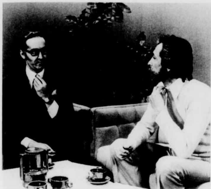
Un homme politique très connu interviewé par un animateur également très connu... Pas de problèmes.