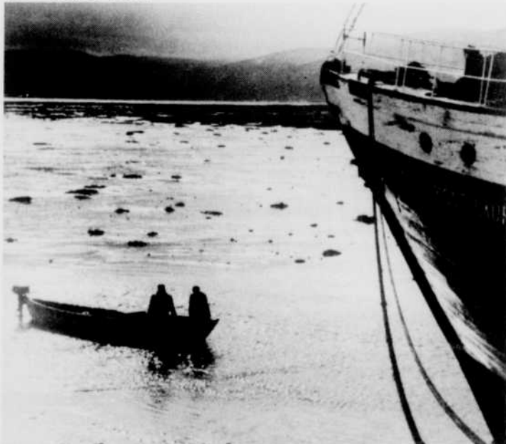
Les Voitures d'Eau