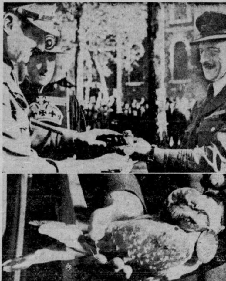
UN PIGEON EST DECORE. Pour avoir sauvé la vie de 100 soldats alliés durant la campagne d'Italie, en parcourant en vingt minutes une distance de 20 milles, ce pigeon voyageur a été décoré au cours d'une cérémonie à la Tour de Londres. On voit, à gauche, le major-général sir CHARLES KEIGHTLEY décorant le pigeon qui tient le commandant d'escadrille LEA RAYNER, chef du service des pigeons voyageurs dans l'armée anglaise.