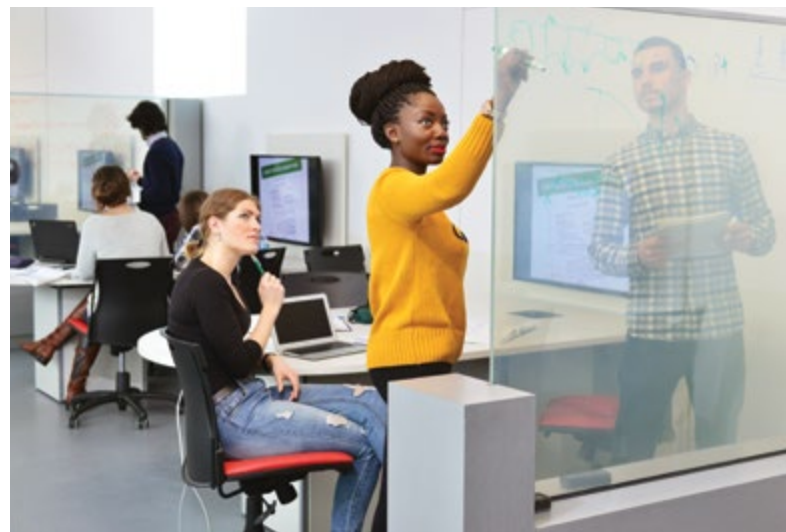
Un donateur anonyme a récemment permis de doter la salle de pédagogie active du pavillon Adrien-Pouliot de séparateurs en «verre intelligent».

Portée par sa volonté d'assurer des lieux d'apprentissage qui font la promotion de pratiques innovantes reconnues, l'Université Laval entend continuer à miser sur cette approche. Or, l'apport philanthropique s'avère un atout précieux, voire essentiel, pour soutenir cette vision et assurer la présence de l'équipement de pointe sur lequel elle s'appuie. Par exemple, une somme allouée par un généreux donateur a récemment permis de doter la salle d'ap-