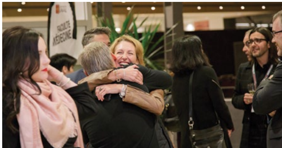
Ce qui ne changera pas avec la nouvelle mouture du Week-end des diplômés: le plaisir de retrouver d'anciens collègues de classe!

Les festivités se poursuivront le lendemain avec des rassemblements, des visites, des conférences et d'autres activités. L'un des points culminants de ce samedi sera la partie que se livreront le Club de football Rouge et Or et les Carabins de l'Université de Montréal. Une ambiance survoltée s'installera au stade TELUS-Université Laval dès l'heure du dîner, à la faveur d'activités d'avant-match originales, tandis que la partie débutera à 14 h.