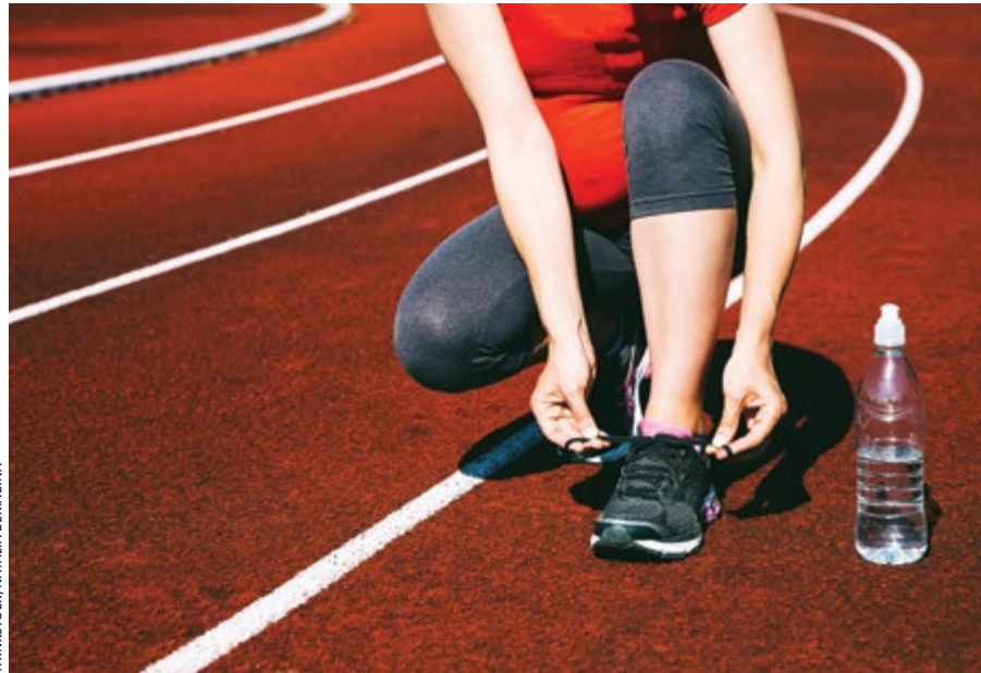
Si elles sont prédisposées à la prééclampsie, les femmes enceintes doivent pour leur part se limiter à des exercices d'intensité modérée.

À la lumière de ces résultats, Isabelle Marc estime que « les femmes dont la grossesse ne présente pas de risque particulier peuvent maintenir, dès le premier trimestre, le