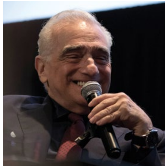
De passage sur le campus en juin, Martin Scorsese a expliqué que ses croyances religieuses avaient fortement teinté son œuvre.

quartier pauvre de New York. Asthmatique, il ne pouvait pratiquer de sport. Ses parents l'emmenaient donc régulièrement au cinéma. C'est là que certains films américains et italiens l'ont marqué. «La salle de cinéma était comme un sanctuaire. J'ai compris que le cinéma pouvait affecter l'âme. Il nous imprègne et nous permet de vivre plusieurs expériences.»