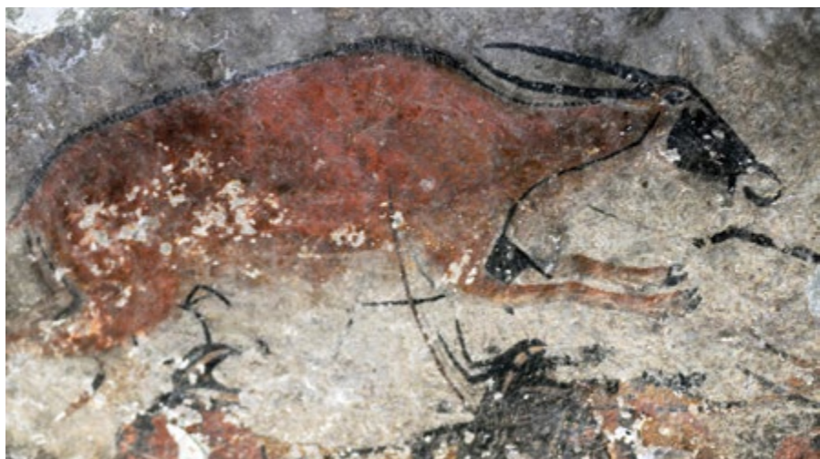
Plusieurs antilopes figurent sur les peintures rupestres étudiées en Afrique du Sud, au Lesotho et au Botswana.

Les chercheurs ont innové en définissant des protocoles rigoureux. Leur approche touchait à la collecte des échantillons, à la caractérisation des échantillons de peinture et à la préparation en vue de la datation au carbone 14. Ces