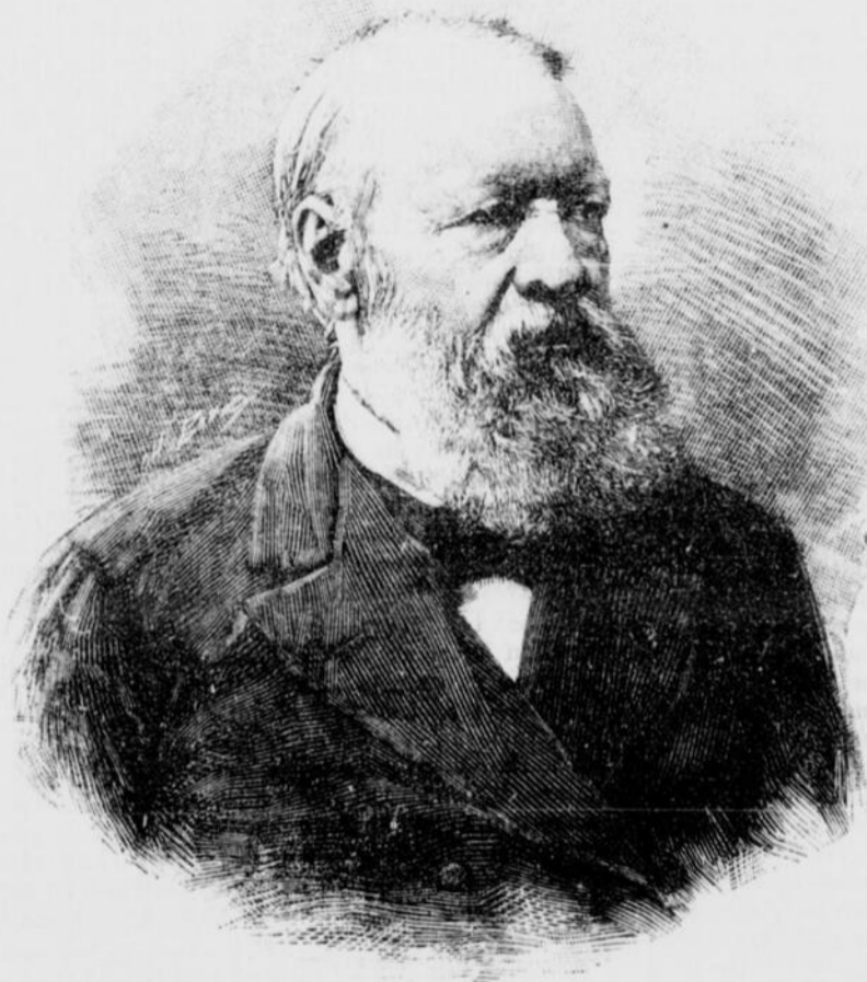
HENRI CONSCIENCE, romancier flamand, mort récemment.