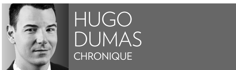
HUGO DUMAS CHRONIQUE

Le petit écran québécois ne nous offre pas une, mais bien deux chroniqueuses télé cet hiver. Laquelle des deux survivrait dans le «vrai monde», pour reprendre une formule chouchou de Réjean Tremblay? Analyse des forces féminines en présence.