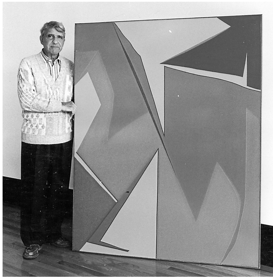
Fernand Leduc en 1990