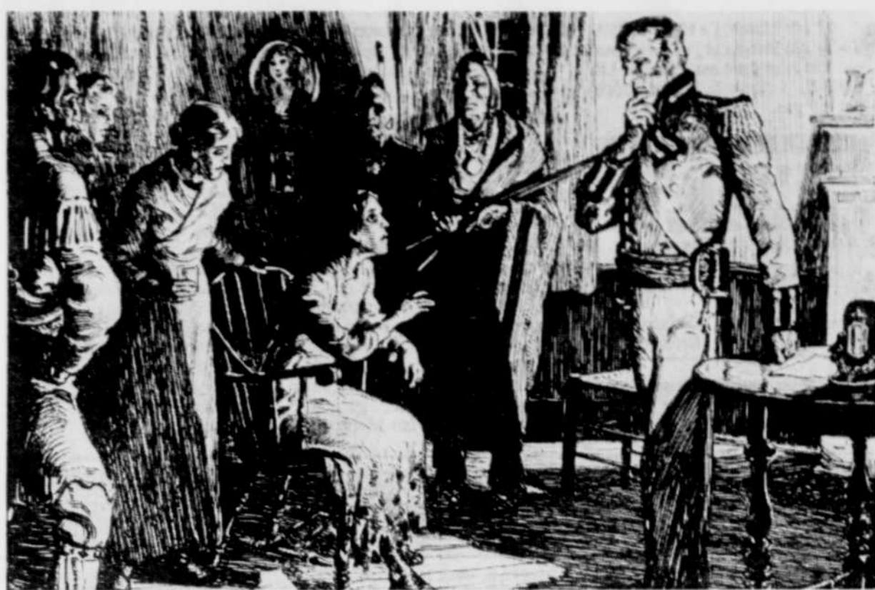
Après avoir parcouru une douzaine de milles à pied, Laura Secord avertit le colonel britannique Fitzgibbon de l'attaque imminente des Américains. Environ 50 plus tard, on reconnaissait officiellement son acte de bravoure. Elle fait aujourd'hui partie des personnages historiques canadiens.

En 1860, Laura a 85 ans et vit à Chippawa. Le Canada salue une visite royale, celle du prince de Galles, futur Édouard VII. L'héroïne, si peu reconnue par ses pairs, décide d'informer le royal visiteur, de lui raconter son équipée et de lui parler des services qu'elle avait rendus à sa patrie.