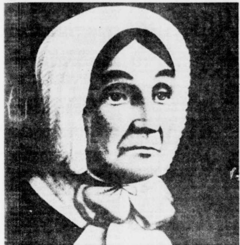
Laura Secord, octogénaire. On a longtemps vu ce portrait sur les produits qui portent son nom. La célèbre héroïne canadienne vécut de 1775 à 1868.

Quant à savoir pourquoi on l'a choisie comme « patronne » d'une fabrique de chocolat, il semble que ce soit seulement une question de prestige. La confiserie, maintenant propriété du groupe Rowntree, aurait simplement voulu associer le prestige de l'héroïne ontarienne à sa marque de commerce. Tout comme les Pétales Champlain. Le fondateur de Québec n'était certainement pas impliqué dans la traite des hydrocarbures! Mais grâce au commerce, le souvenir de Laura Secord persiste.