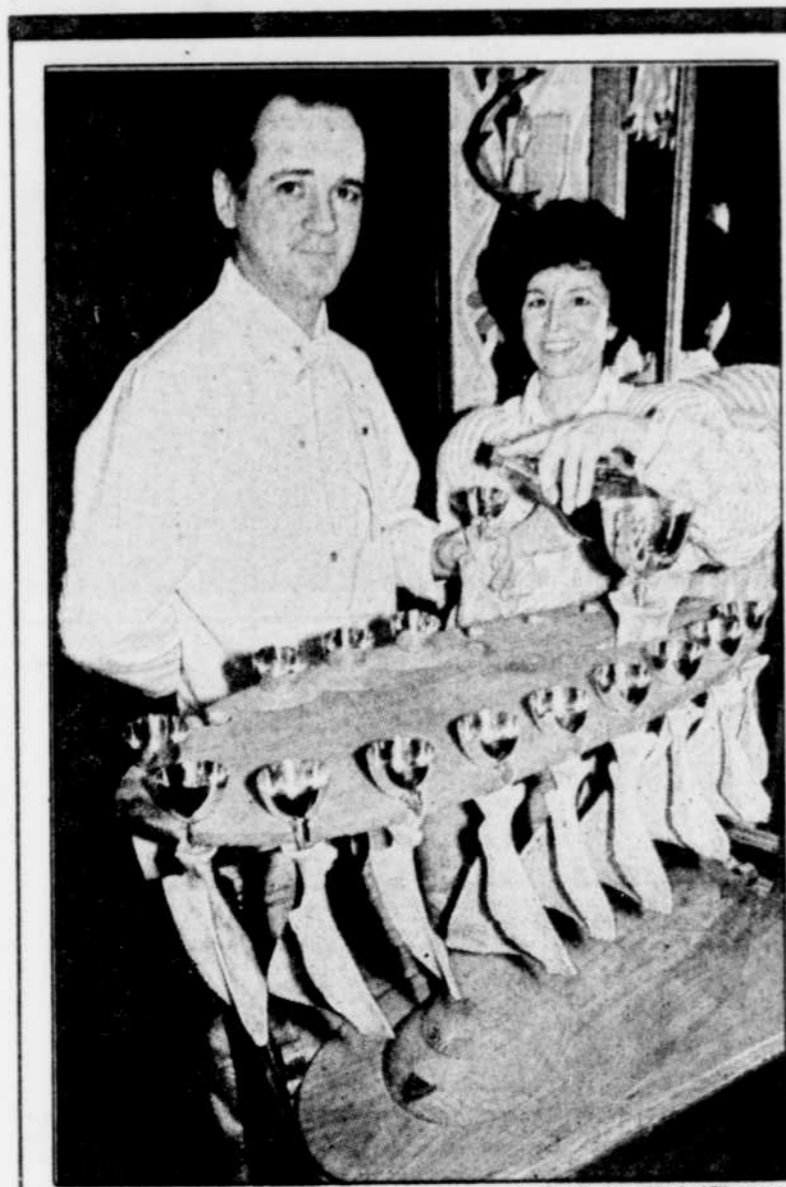
Le Soleil, Jean-Marie Villeneuve