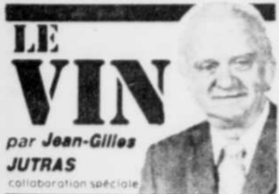
LE VIN par Jean-Gilles JTRAS collaboration spéciale

Encore une fois, sans avoir lu l'article auquel se réfère le plaidoyer de M. Duboeuf, je crois cependant qu'on peut toujours faire confiance aux vins du Beaujolais et en boire sans aucune crainte. C'est du vin fort agréable, et, dans la plupart des cas, fabriqué selon les règles de l'art.