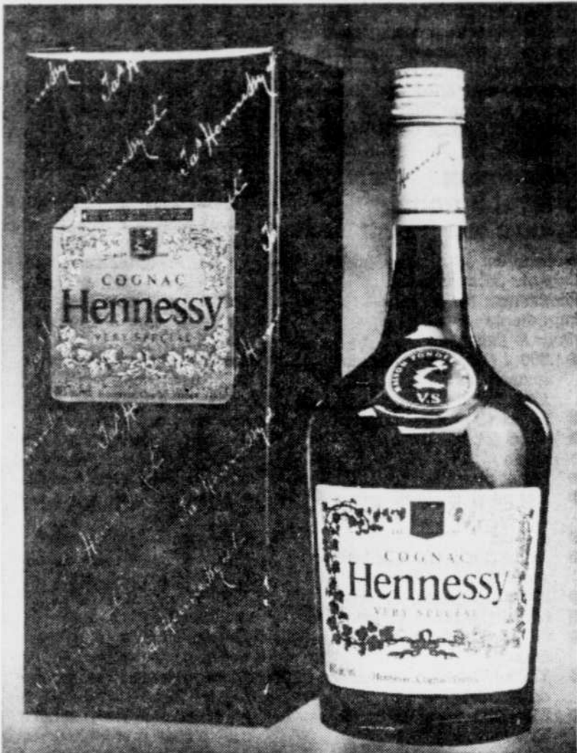
La période de vieillissement du cognac peut durer de trois à cinq ans mais aussi de 10 à 50 ans. Chez Hennessy, on est fier d'annoncer qu'on possède les plus vieux cognacs qui serviront, sans doute un jour, à préparer les grandes bouteilles qui font la renommée de la maison.