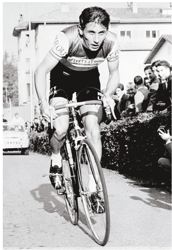
Jacques Anquetil, cinq fois champion du Tour de France, en 1958.

Si cette incursion du Tour touche une corde sensible chez les nationalistes, ils ne le laissent guère savoir. Les habituels slogans anti-hexagonaux tagués sur les murs et les cailloux dans les montagnes aléatoires rappellent cependant qu'on n'est pas tout à fait en France ici.