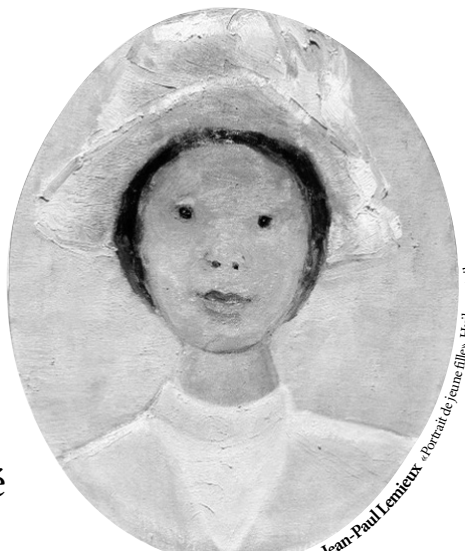
Jean-Paul Lemoine - portrait de jeune fille - Huile sur toile