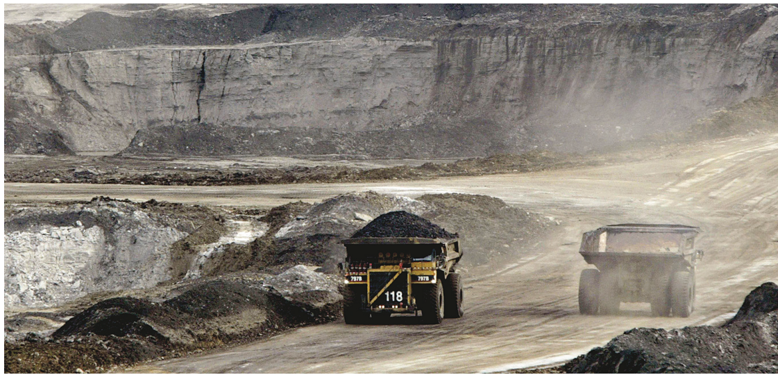
Exploitation de sables bitumineux à Fort McMurray. Le sous-sol albertain contiendrait pas moins de 167 milliards de barils de ce pétrole, que les exploitants cherchent à exporter.