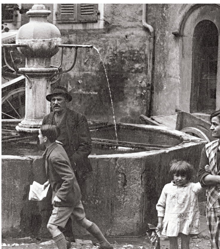
4. coureur se ravitaille en eau dans une fontaine. Dans les premières aussi casser la croûte.

fermier qui semblait faire du vélo pour le plaisir (en 1971, Poulidor, blessé, a fait un Tour de France en solo, un jour avant le peloton).