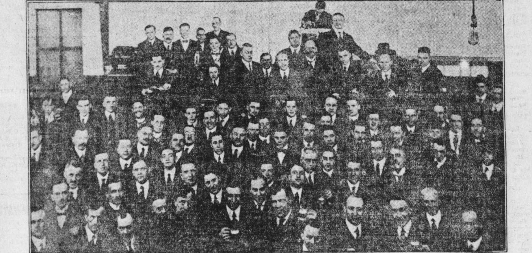
Groupe de quelques-uns des voyageurs de commerce qui ont visité, samedi, la Brasserie Frontenac.

L'ENCOURAGEMENT A DONNER A L'INDUSTRIE CANADIENNE