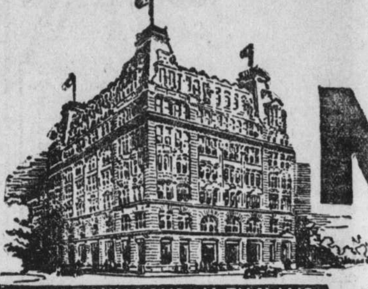
7 MILLBANK, LONDON, ENGLAND