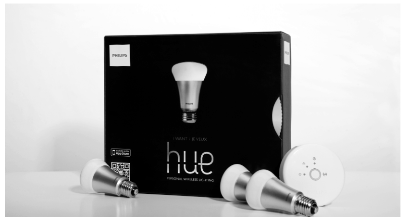
Les ampoules intelligentes Hue

Les détenteurs de la plupart des modèles LG 3D achetés depuis 2012 devraient donc pouvoir y louer directement des films ou des documentaires en grande qualité 3D.