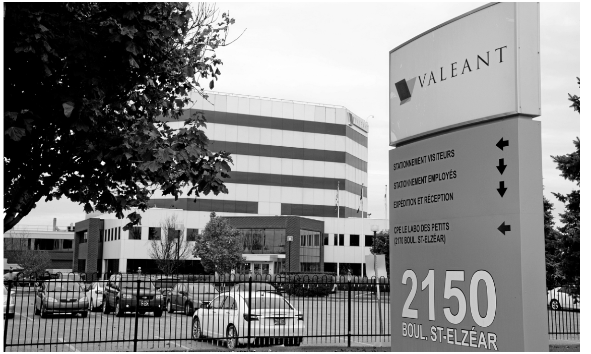
Valeant s'attend à des revenus allant de 9,2 milliards US à 9,3 milliards US en 2015, ce qui représenterait une hausse comparativement aux revenus estimés de 8,1 milliards US enregistrés l'année dernière.

Hier, l'action de Valeant a bondi de 10,64 $ (+ 6,2%), à 182,28 $, à la Bourse de Toronto.