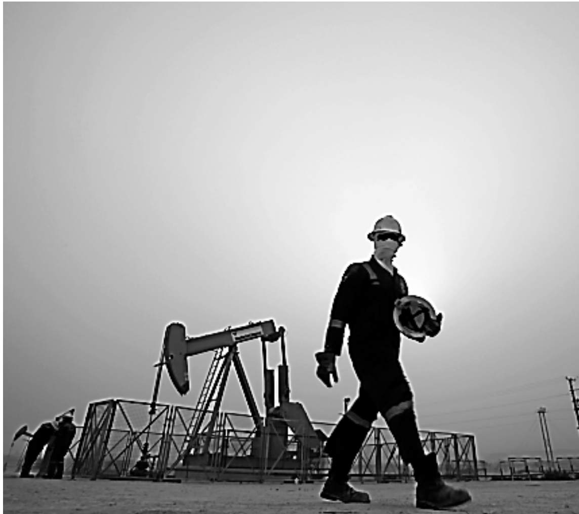
Les cours du pétrole coté à New York ont fini la séance avec une petite hausse, même s'ils se maintiennent sous les 50$US le baril.

Les inscriptions hebdomadaires au chômage ont baissé la semaine dernière sous la barre des 300 000, selon un chiffre publié dans la matinée, tandis que les cours du pétrole coté à New York ont fini la séance avec une petite hausse, même s'ils se maintiennent sous les 50$US le baril. « Pris ensemble, ces deux éléments ont