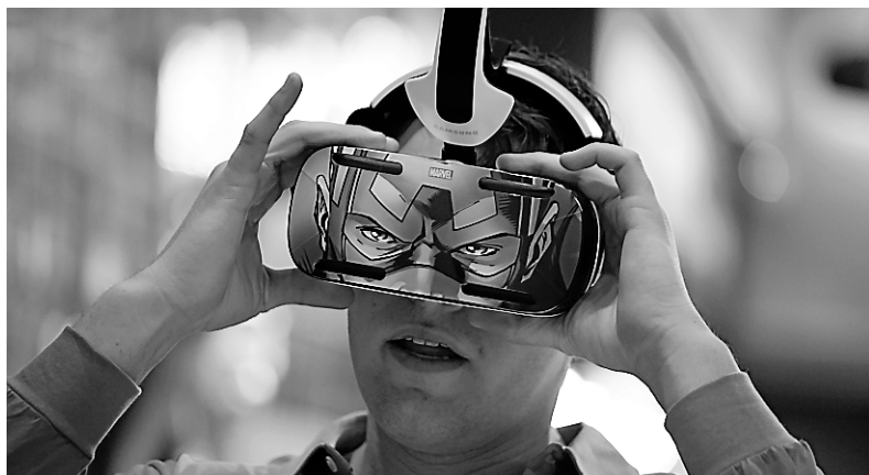
Le casque Gear VR

Tous peuvent interagir avec d'autres appareils de la gamme ou avec des données