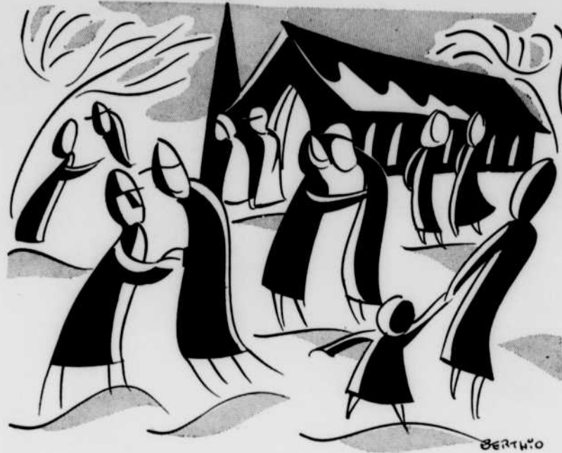
Veille de Noël

Et peut-être Noël est-il avant tout la fête des artisans, car c'est la fête de Celui et de ceux pour qui le travail des mains est resté la règle première de beauté.