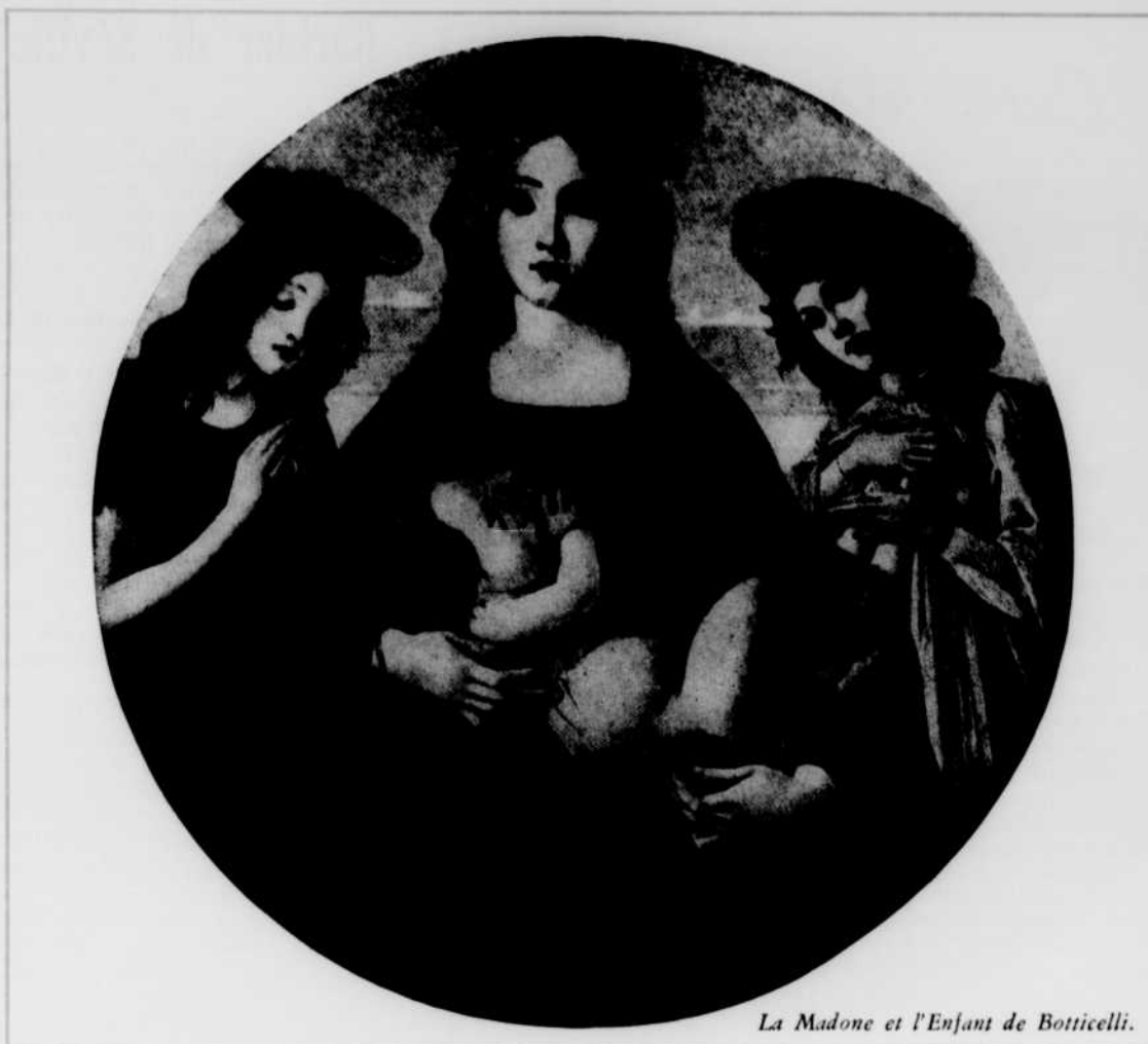
La Madone et l'Enfant de Botticelli.

La renommée des Disciples de Massenet a depuis longtemps franchi les frontières de notre pays. En 1950, ce chœur mixte était invité par le Gouverne-