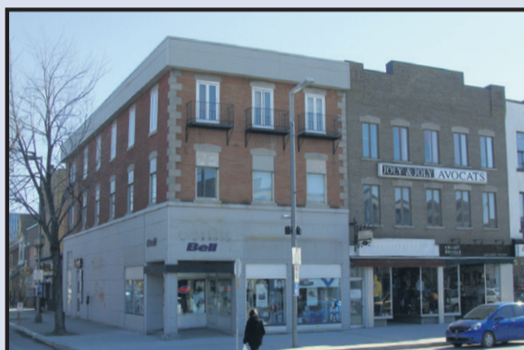
Avant la restauration