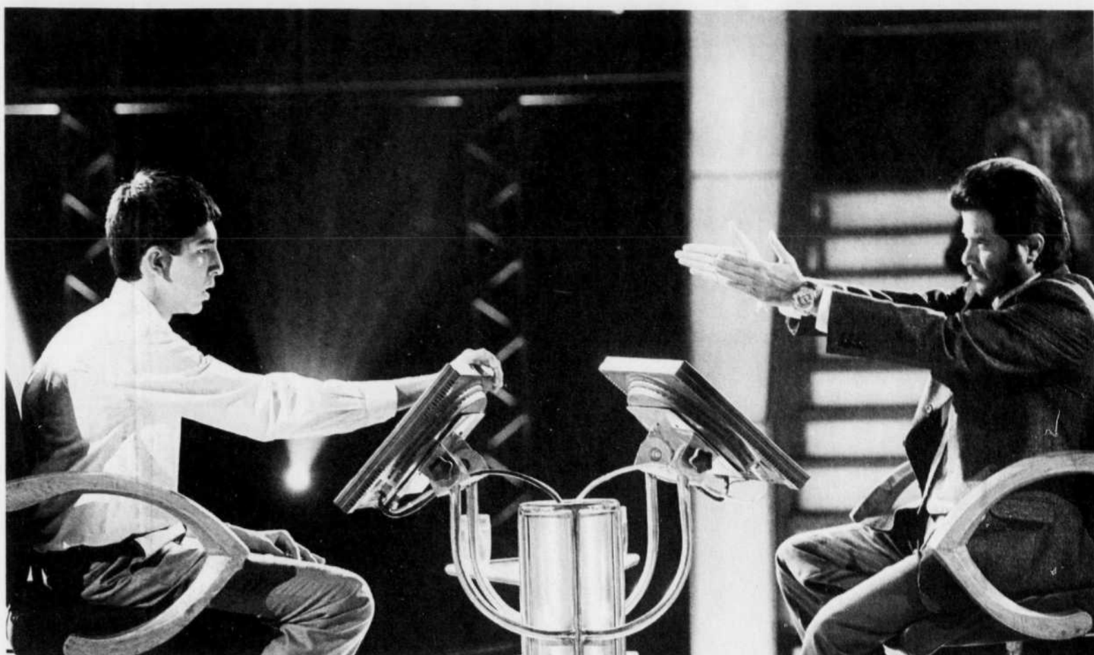
Des films comme Babel , Slumdog Millionaire (ci-dessus) ou Blindness nous indiquent qu'il y a d'autres voies d'ouverture au monde que l'américanisation.

Il parle ensuite éloquentement de la réticence de beaucoup d'écrivains de petites nations à s'engager résolument dans l'ère de la littérature mondialisée,