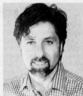
François Croteau - 37 ans - Maire de l'arrondissement de Rosemont-La Petite-Patrie - Vision Montréal - Chargé de cours à l'UQAM

trop tôt pour commenter son imminente accession à la mairie de cet arrondissement.