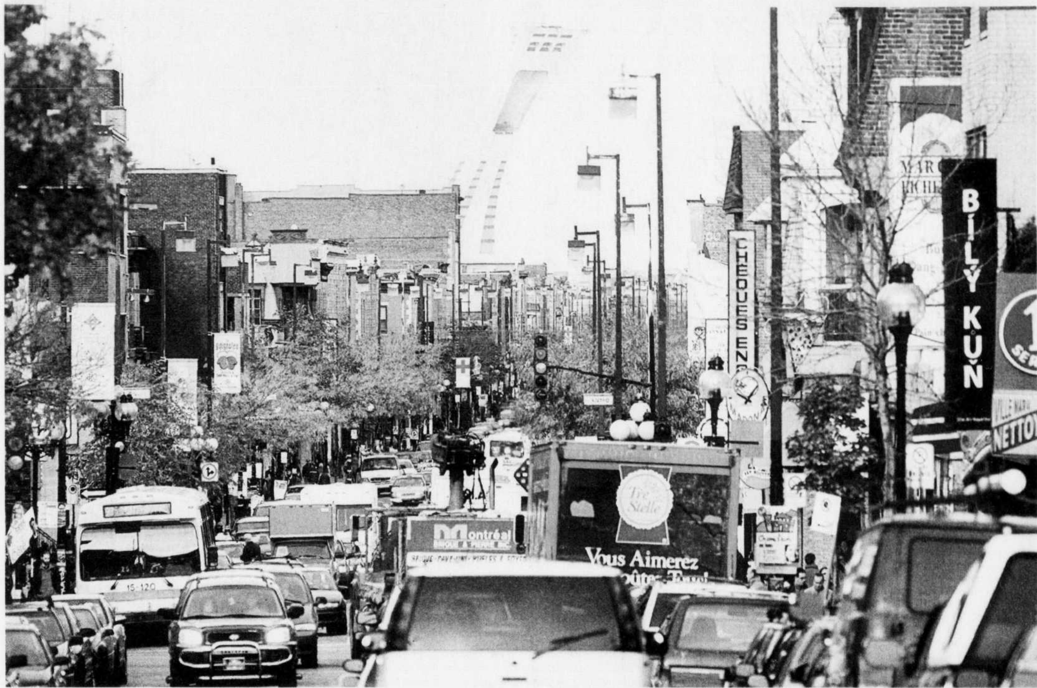
JACQUES GRENIER LE DEVOIR

Après les élections municipales à Montréal