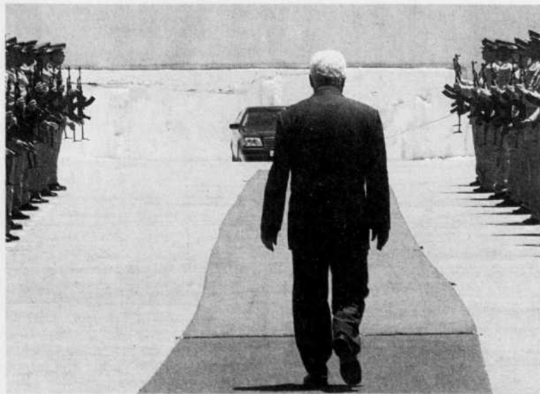
Mahmoud Abbas a annoncé jeudi à son entourage politique qu'il ne serait pas candidat à sa propre succession lors des élections générales du 24 janvier.

Soit Mahmoud Abbas a bel et bien décidé de se retirer, soit il s'agit d'un coup de poker politique. Faute d'un accord préalable avec le Hamas, qui contrôle la bande de Gaza, les élections ont très peu de chances de se tenir en janvier 2010. Son annonce peut avoir valeur d'avertissement à l'attention des États-Unis après la défaite enregistrée par l'Autorité palestinienne sur la question du gel de la colonisation. Mais si Mahmoud Abbas espère reprendre la main, il aura fort à faire pour retrouver un semblant de légitimité. Accusé d'avoir retardé un vote onusien sur le rapport Goldstone à propos de la guerre