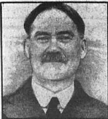
IL A INVENTÉ LE BASKETBALL.