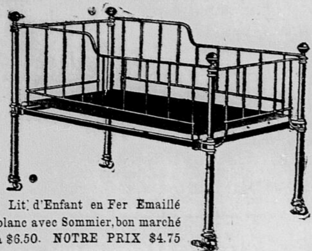
Lit d'Enfant en Fer Emaillé blanc avec Sommier, bon marché à $6.50. NOTRE PRIX $4.75

Meubles de tous genres et a des prix defiant toute competition.