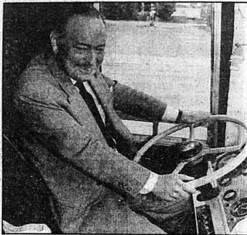
Jacques Parizeau, chef conducteur du PQ

Le PLQ demande au CRTC, notamment, de «vérifier les codes d'éthique journalistique en vigueur (s'il en est) à Télé-Métropole et TVA; d'exiger des modifications qui s'imposent à ces codes et dans les mécanismes de surveillance des informations, afin d'assurer la diffusion d'une information juste et honnête et de réprimer sévèrement les télédiffuseurs en cause».