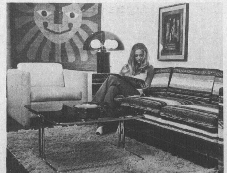
La tendance est au moderne dans l'ameublement d'aujourd'hui — sans sacrifier le confort et la commodité. Des tissus et finis faciles d'entretien — tels que les mélanges de laine et de rayon, de verre et d'acryliques — laissent amplement de temps pour la détente.