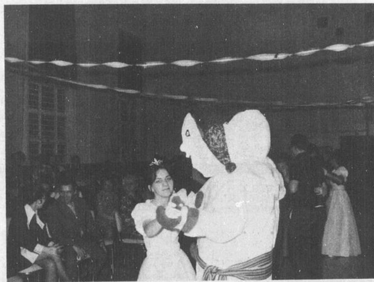
Quoi de plus approprié pour clôturer cette soirée émouvante que la danse traditionnelle. La Reine et le Bonhomme ont ouvert le bal et peu après, l'assistance imita leur geste.