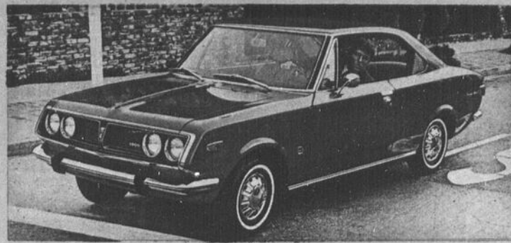
Corona Mark II

LA TOYOTA CORONA MARK II DE PLUS, ELLE EST SPORTIVE, ECONOMIQUE A L'ACHAT ET A L'USAGE. VOYEZ-LA CHEZ