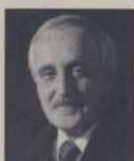
Monsieur Gilles Cloutier Recteur Université de Montréal