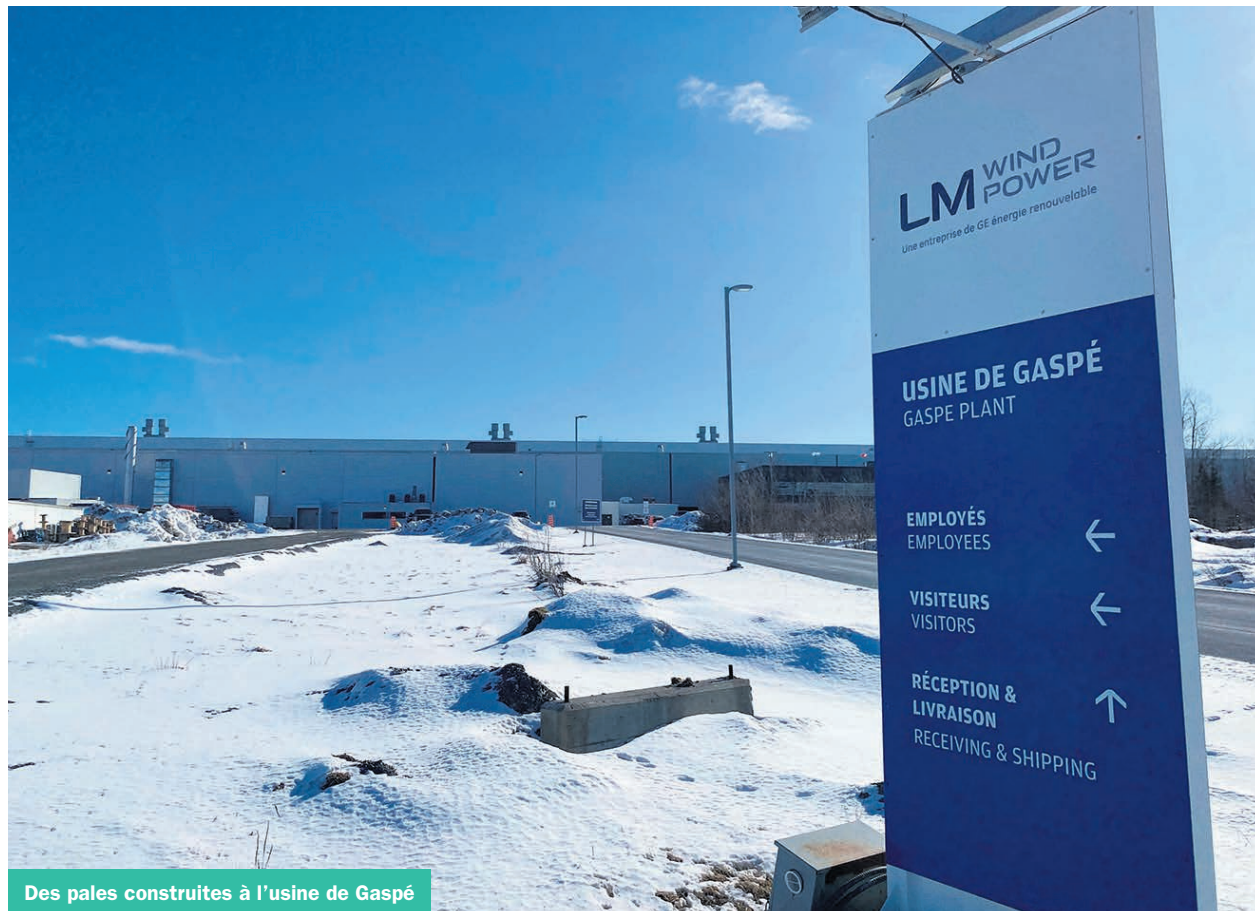
Des pales construites à l’usine de Gaspé

À l’heure où Hydro-Québec veut installer 10 000 mégawatts supplémentaires d’énergie éolienne dans la province, certains se demandent si les manufacturiers québécois vont manquer le coche. Outre l’usine de pales à Gaspé, Marmen Énergie a relancé sa production de tours à Matane. Heureusement pour elle, une entente a été conclue plus tôt l’an dernier avec Invenergy, l’Alliance de