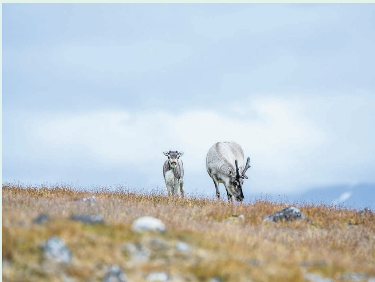
Le total minimal est de 30 caribous montagnards en Gaspésie, en hausse comparativement aux 22 inventoriés l'an dernier.

Une trentaine de caribous ont été observés dans les Chic-Chocs, selon l'inventaire et les données partagés vendredi dernier par le ministère de la Faune.