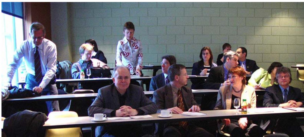
Formation sens politique le 28 avril 2005 à Montréal