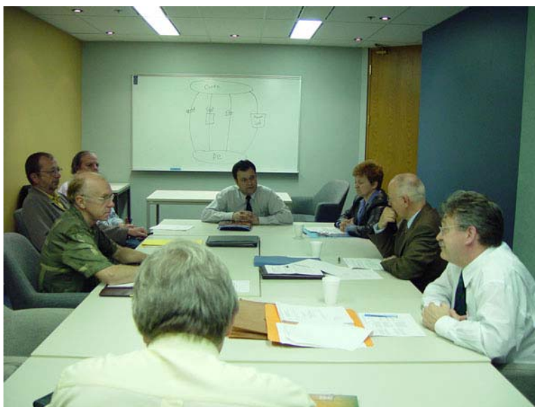
Comité tripartite CCGP-CRISP-SCT

La commission a remis sur pied le comité tripartite CCGP-CRISP-SCT afin de permettre au Secrétariat du Conseil du trésor de s'appropriier les problématiques qui confrontent les membres du CRISP . Les dossiers prioritaires du comité ont été les suivants : l'embauche des occasionnels, le recrutement, la rétention des ressources et la classification du personnel.