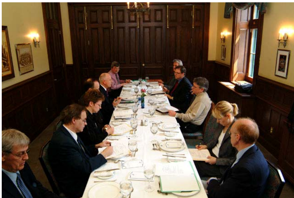
Commission Gestion des ressources humaines en TI