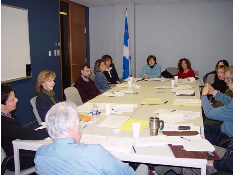
Sous-comité sur la gestion électronique documentaire