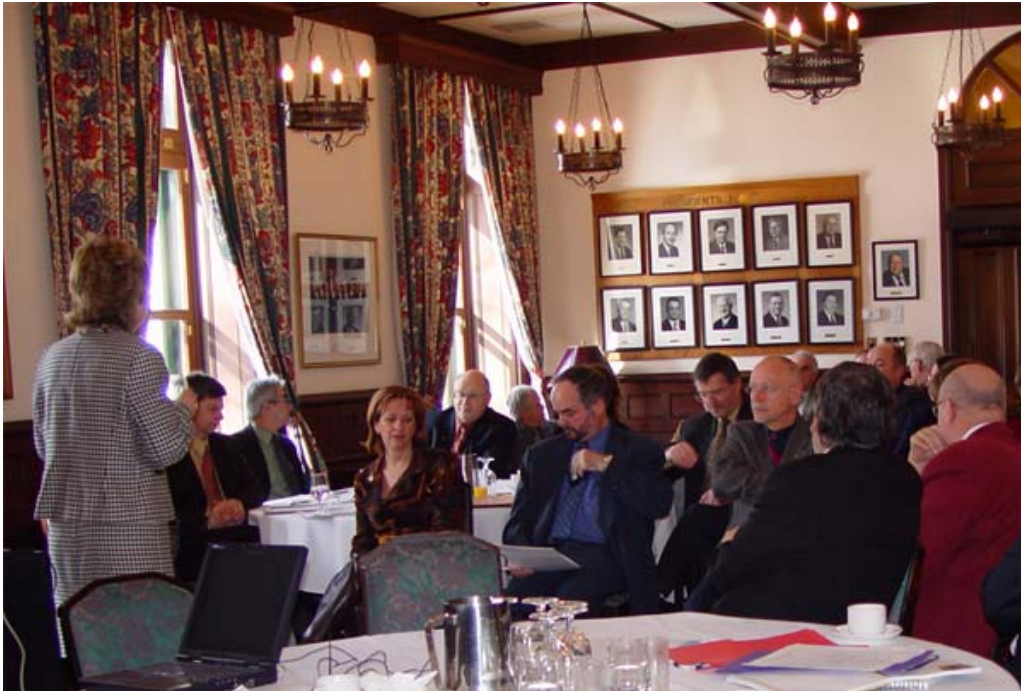
Membres en assemblée