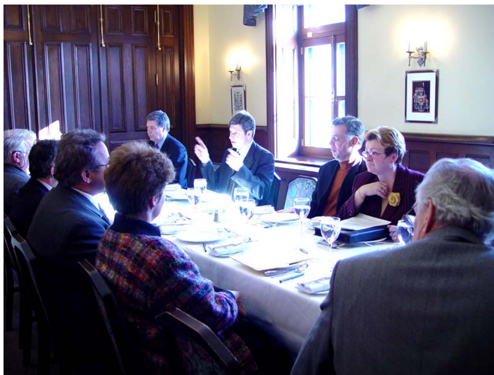
Commission Gestion des ressources informationnelles II