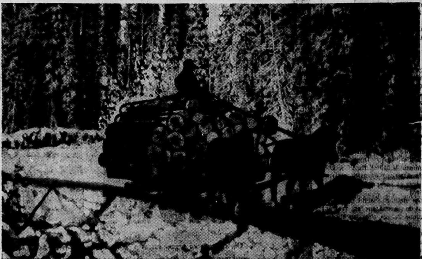
Exploitation forestière dans le Québec. Transport des billes sur bûches pour l'expédition en usine.