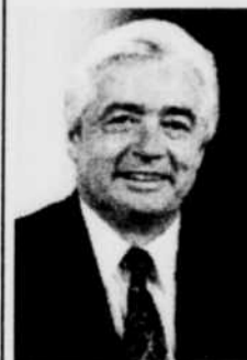
Réjean Lefebvre député

également des séjours hors de l'ordinaire. Il suffit de se procurer le guide touristique de la MRC du Haut-Saint-Maurice au kiosque du Parc des chutes pour en savoir davantage. Les gens sur place sauront répondre à toutes les questions.