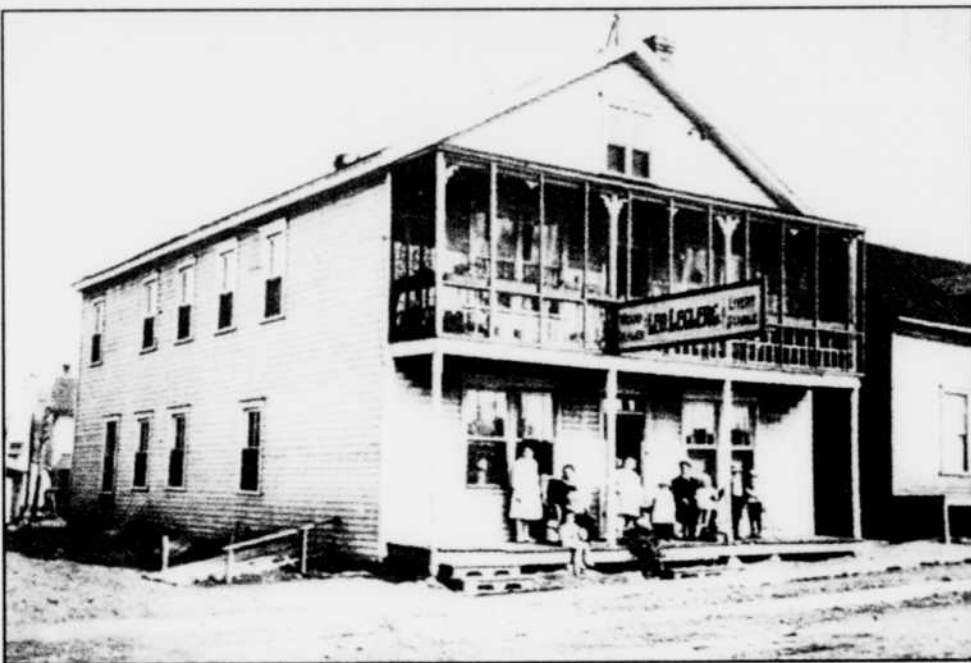
C'est dans cette maison de la rue Tessier que le jeune Félix Leclerc a passé les 14 premières années de sa vie à La Tuque avec sa famille.

Le Circuit Félix-Leclerc débute au Parc des chutes de la petite rivière Bostonnaise, à l'entrée sud de la ville de La Tuque, au bureau d'information touristique. Les agents d'information vous indiqueront où se trouvent les 17 panneaux d'identification du circuit et peuvent pour prêter, moyennant un dépôt de quelques dollars, une cassette ou un disque compact racontant l'histoire de Félix étape par étape. Vous reconnaîtrez alors la voix chaude du poète grâce à la collaboration de l'imitateur latuquois Claude Landré.