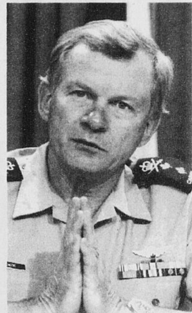
Le major-général Lewis MacKenzie

«J'aimerais constater qu'on consacre des efforts à amener les parties du conflit en Bosnie à se parler