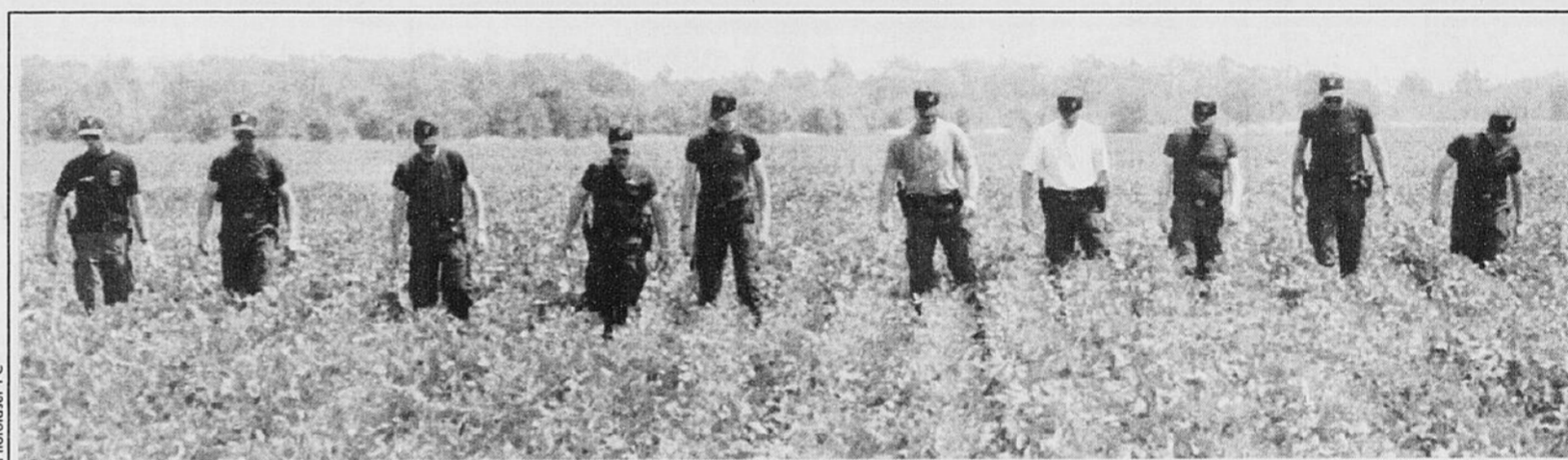
Des membres de l'escouade tactique de la police ontarienne fouillent, à Petrolia, près de Sarnia, un champ de fèves à la recherche d'indices à la suite d'un triple meurtre survenu sur une ferme

Mais le ministère prévoit que d'ici la mi-août, on aura expédié des chèques à environ 9000 pêcheurs et plus de 6000 travailleurs d'usines.