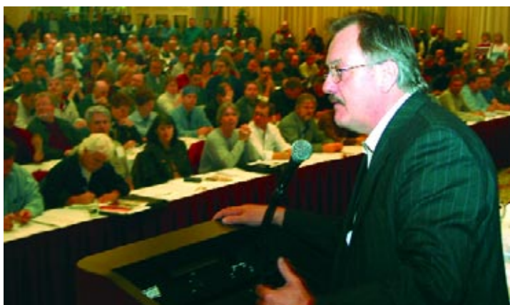
Devant près d'un millier de militants et militantes réunis en conseil consultatif, le 17 novembre, le président de la FTQ, Henri Massé, a appelé à la mobilisation pour contrer les politiques de droite du gouvernement libéral-conservateur de Jean Charest.

vraie nature de ce parti libéral-conservateur.