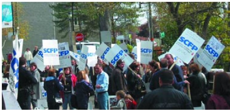
Une manifestation conjointe au sujet de l'horaire des bibliothèques, bel exemple de la collaboration entre les cols blancs et les cols bleus de Terrebonne.

Autre point majeur, les cols blancs ont défini le cadre du processus de dotation des postes. On a fixé des balises pour les tests, tout en s'assurant que le choix des candidats tiendra compte de leur expérience. Ainsi, le processus mis en place favorisera désormais le cheminement de carrière des cols blancs. Désormais, les employés pourront développer leur expertise, pour le plus grand bénéfice de la population. « Cette convention est une belle réussite qui démontre que les deux parties partagent une même vision d'avenir. C'est grâce à la mobilisation que nous avons été en mesure d'arriver à un tel résultat. Nous avons maintenant un petit bijou de convention collective ! », conclut Johanne Pedneault, présidente du SCFP-2326.