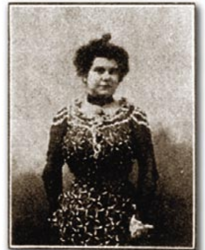
Colombine, ou Musette, ou Éva... poétesse, dramaturge, journaliste, essayiste et surtout militante de la première heure pour les droits de la femme et de la classe ouvrière.

Elle prône l'intervention de l'État pour faire respecter le salaire minimum et les normes du travail. Le travail rémunéré, tout comme l'éducation, demeure le gage de l'émancipation féminine qu'il faut défendre par tous les moyens.