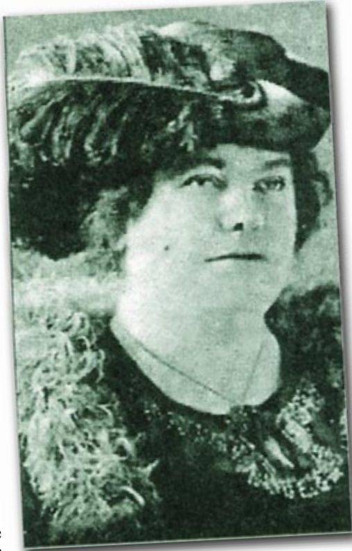
Éva Circé-Côté (1871-1949) Fondatrice de la Bibliothèque municipale de Montréal, chroniqueuse au journal Le Monde ouvrier de sa fondation en 1916 à 1938, sous le pseudonyme de Julien St-Michel.

Hommes et femmes doivent avoir accès à des écoles techniques pour recevoir