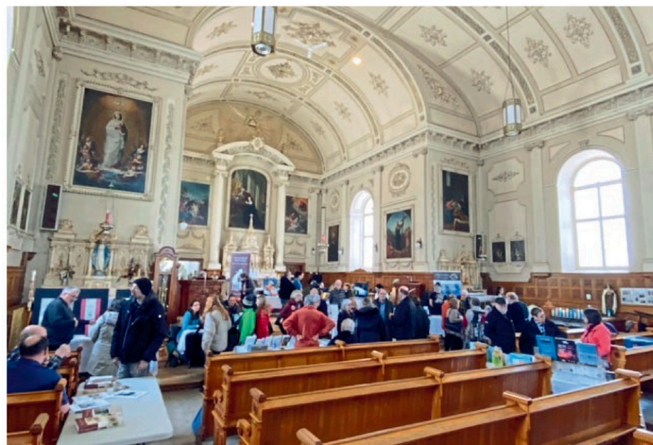
La première édition du Salon du livre du Café des 3 cloches avait attiré 250 personnes.

La deuxième édition du Salon du livre du Café des 3 cloches se tiendra le 23 février prochain, de 13 h à 16 h, à l'église de Sainte-Gertrude. (SP)