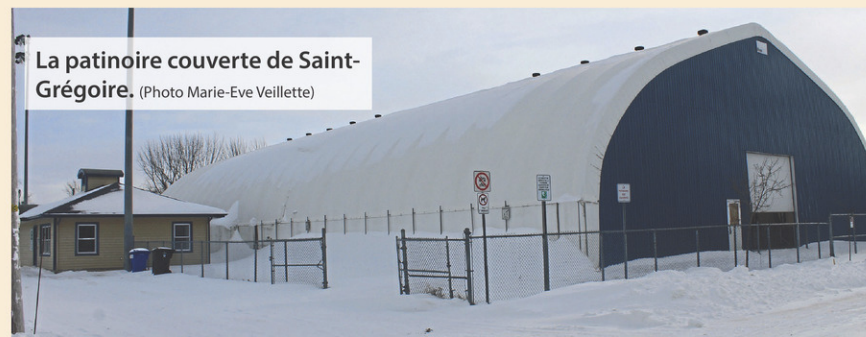
La patinoire couverte de Saint-Grégoire.

«On est très heureux, parce que le fait que les bénévoles reprennent l'entretien et l'arrosage de