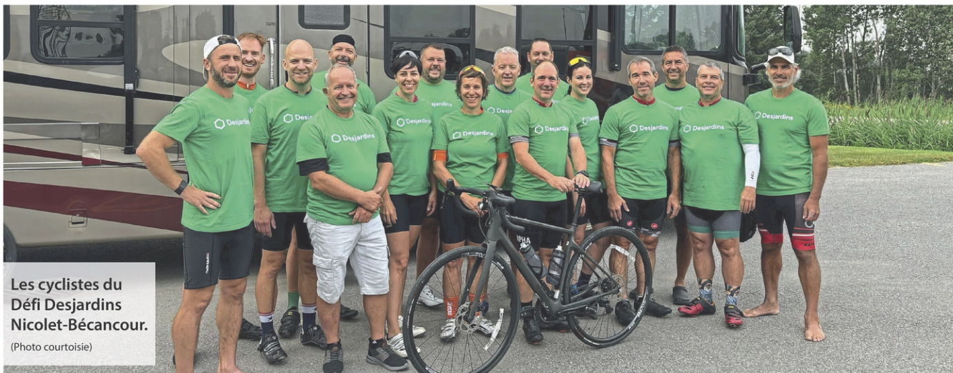
Les cyclistes du Défi Desjardins Nicolet-Bécancour.

Étant donné la situation, l'appellation du Défi sera évidemment modifiée. Le mot «Key West» sera