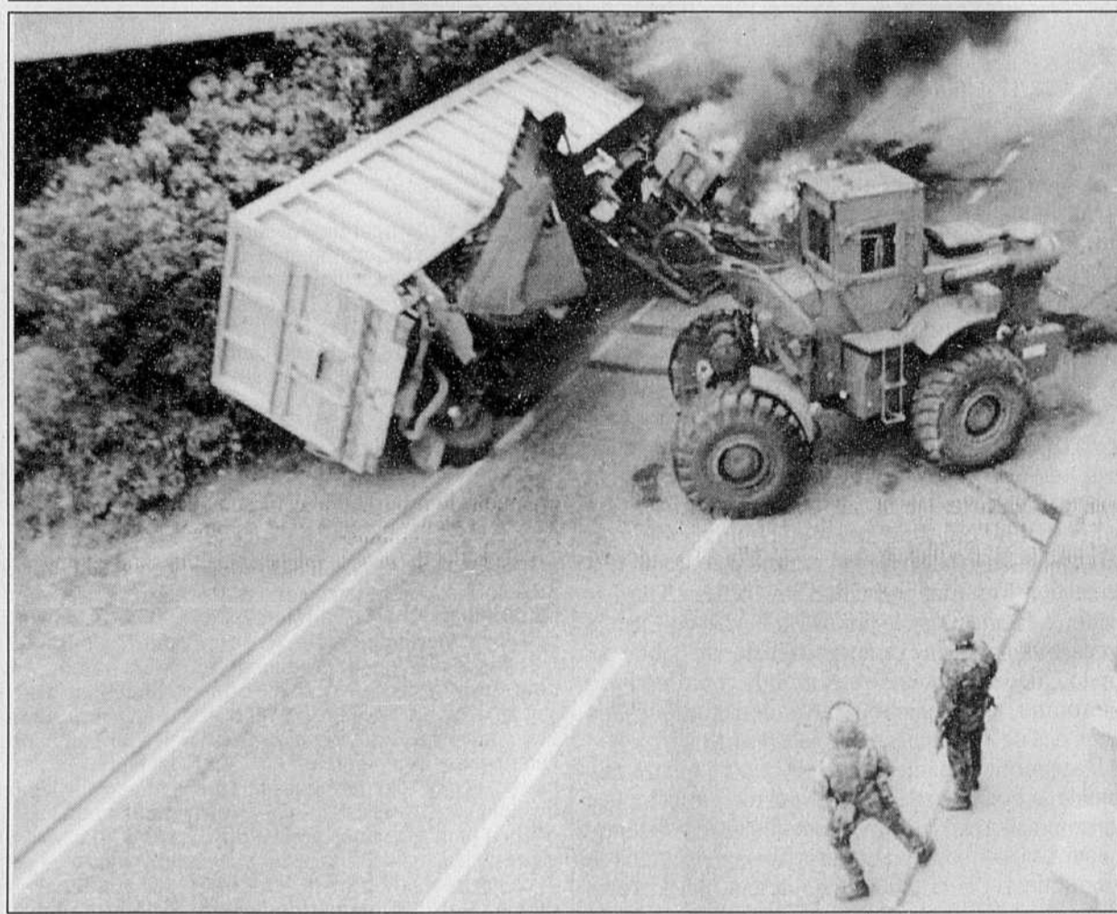
Des ingénieurs de l'armée britannique ont dégagé hier une route de Portadown, en Irlande du Nord, qui avait été bloquée par des manifestants protestants.

Il s'est également engagé à consolider la paix avec le Pérou — 18 mois après le conflit frontalier entre les deux pays qui avait failli dégénérer en conflit généralisé — et à relancer le tourisme.