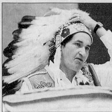
Ovide Mercredi portant sa coiffe de grand chef.

Ignoré par les autorités politiques fédérales, le grand chef se fait le promoteur depuis quelques mois d'un projet souverainiste autochtone. À son avis, le partenariat avec Ottawa a échoué et ne vise que l'assimilation des Amérindiens. Par conséquent, il condamne les bandes qui concluent des accords bilatéraux