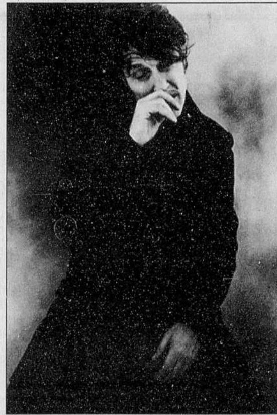
Le Flamand Arno offre son spectacle «à la française» ce soir à 20h.

Si la pluie devait s'y mettre, les spectacles intérieurs laissent aussi de beaux refuges aux festivaliers. À 20h, Angélique Ionatos prend la scène du Grand Théâtre de Québec pour le premier de quatre spectacles dédiés à la musique de Mikis Théodorakis, tandis que les Watchmen de Winnipeg offriront au d'Auteuil, à 21h, un rock très canadien , et que le très attendu Miossec livrera, à 23h, au Périscope, le dernier de ses deux spectacles à Québec.