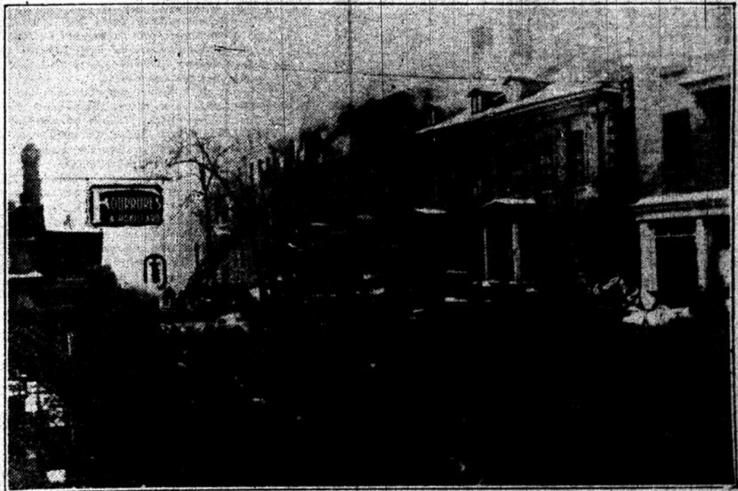
Un gros incendie qui a éclaté, samedi après-midi, au No 1088, rue Saint-Denis, a rendu une bâtisse de trois étages, pratiquement hors d'usage. Cette vignette a été prise tard, dans l'après-midi, par le photographe de l'«Illustration», au moment où les pompiers s'étaient rendus maître de l'élément destructeur.