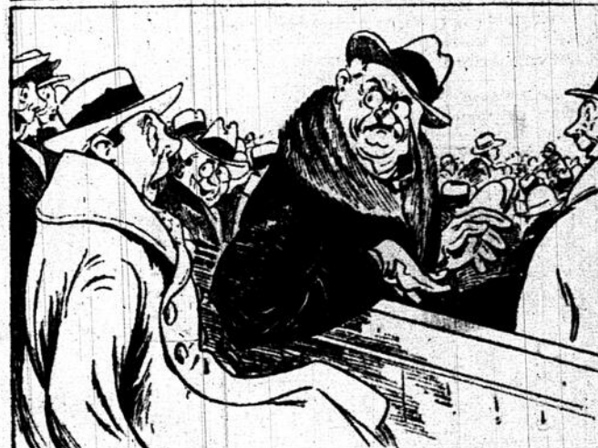
—mais désastre, quand il se retourne et te dévisage — tu reconnais ton patron!