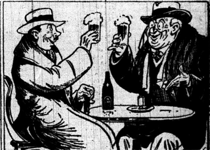
Tas pas déjà essayé une BLACK HORSE? Il n'y a que ça pour remettre les choses au point.

dites simplement — "Bière Black Horse Dawes s.v.p.!"