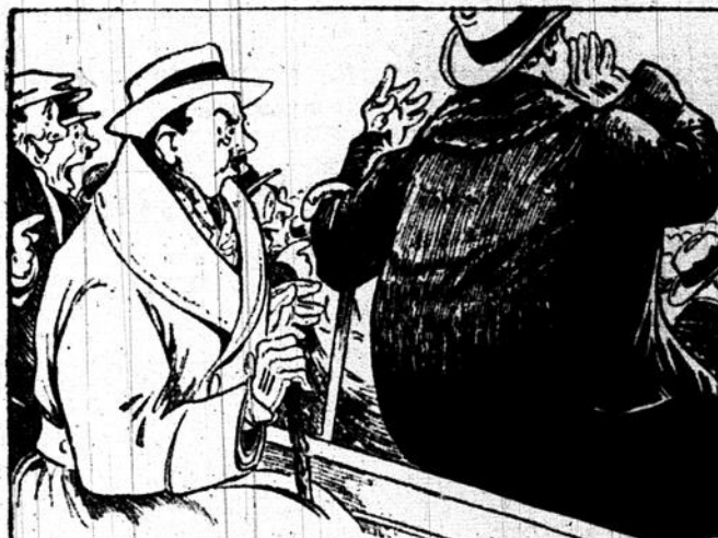
Tas pas déjà senti ton impatience croître graduellement devant les agissements d'un vis-à-vis trop nerveux et encombrant, à une partie de hockey —