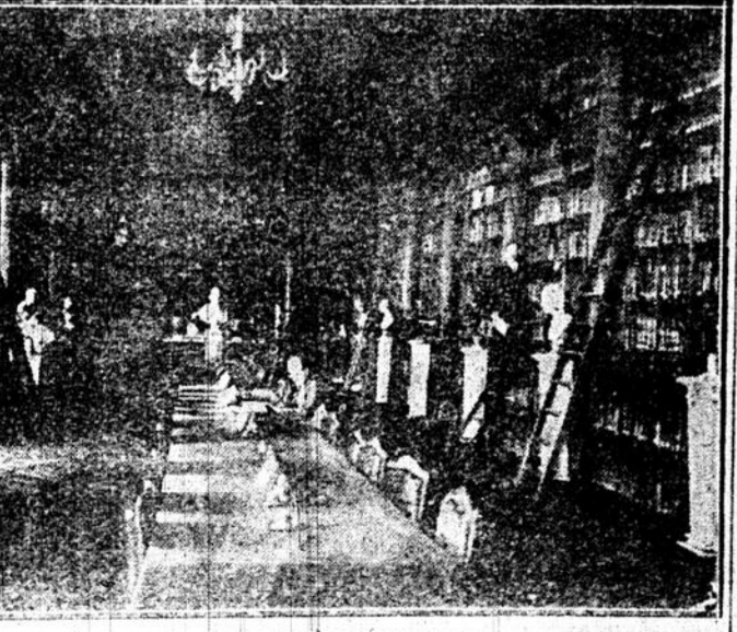
LA BIBLIOTHEQUE MAZARINE—Voici une vue intérieure de la bibliothèque Mazarine qui, à la suite du décès de M. de Porto-Riche, son ancien conservateur, est rattachée à la bibliothèque Nationale de Paris.

Au 1er février, 4,576,894 boisseaux avaient été chargés des élévateurs dans les cargos, comparativement à 1,813,162 pour la même période l'an dernier. Ce grain était pour la plus grande partie destiné aux