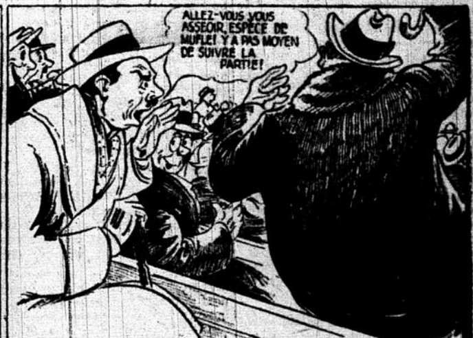
—et lorsque survient une explosion d'enthousiasme plus forte que les autres, tu n'y tiens plus et tu lui dis son fait en langage énergique —